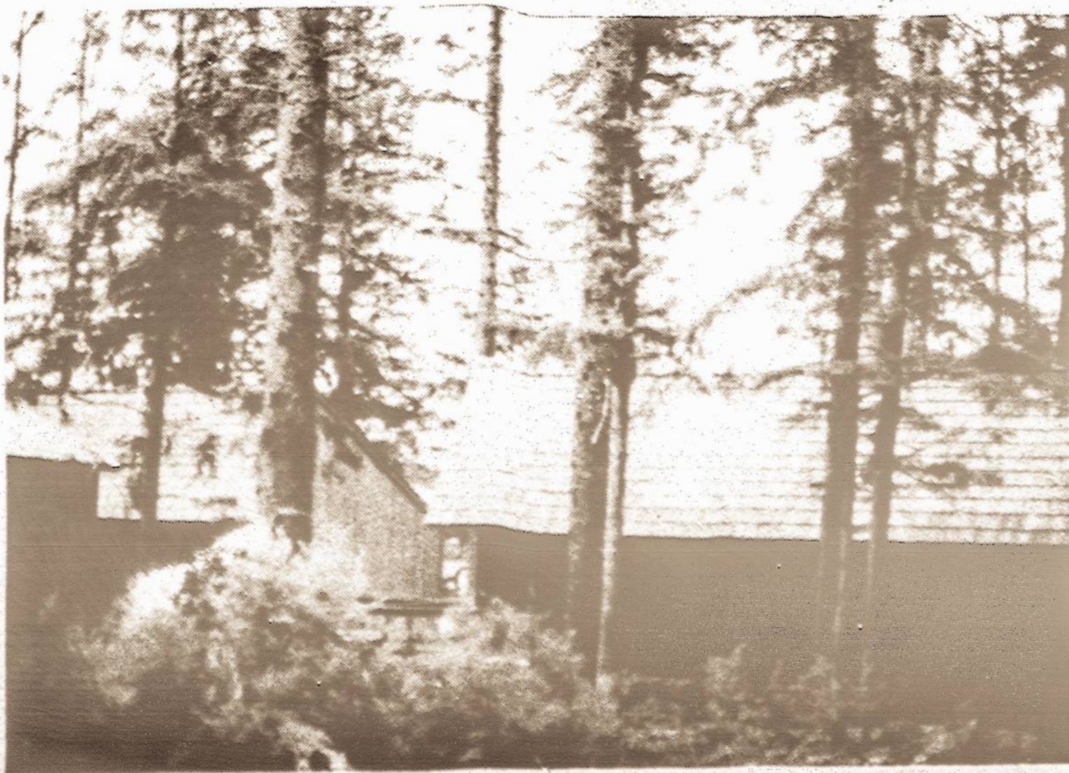
Our lodge, where bears walked freely past our windows.

We talked with a bright young Tlingit Indian who works in a Cont'd on page 9