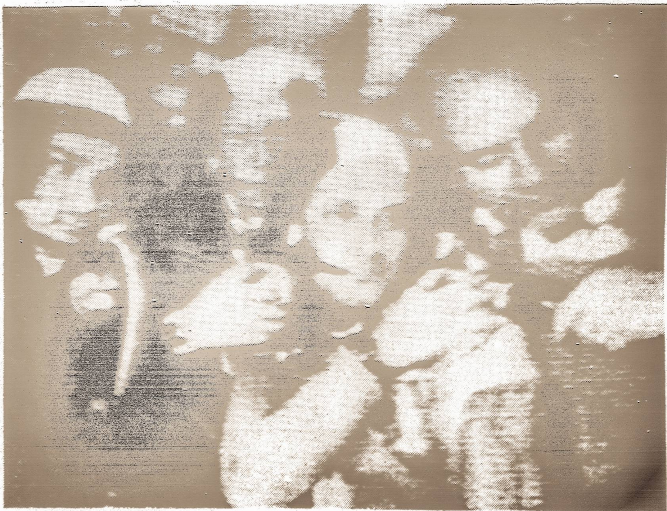
Istorinis Amerikos astronautų ir Sovietų Rusijos kosmonautų susitikimas erdvėje. Sovietų Soyuz erdvėlaivyje jie klausosi JAV Prezidento Fordo kalbos. Iš kairės: Valery N. Kubasov, pulk. Aleksai A. Leonov, Brig. generolas Thomas P. Stafford ir Donald K. Slayton, Vance D. Brand buvo pasilikęs Apollo erdvėlaivyje.

Amerikos ukrainų trijų milijonų fondas, kaip žinoma, pasirašė sutartį su Harvard universitetu, kuris įkūrė ukrainistikos profesūrą. Šią vasarą suruošta šešeto savaitių ukrainų kalbos vasarinis kursas (pradinis, vidurinis ir aukštesnysis) bei ukrainų istorijos kursas su paskaitomis apie sovietinę Ukrainos respubliką. Kursai kainuoja nuo $350 iki $700.