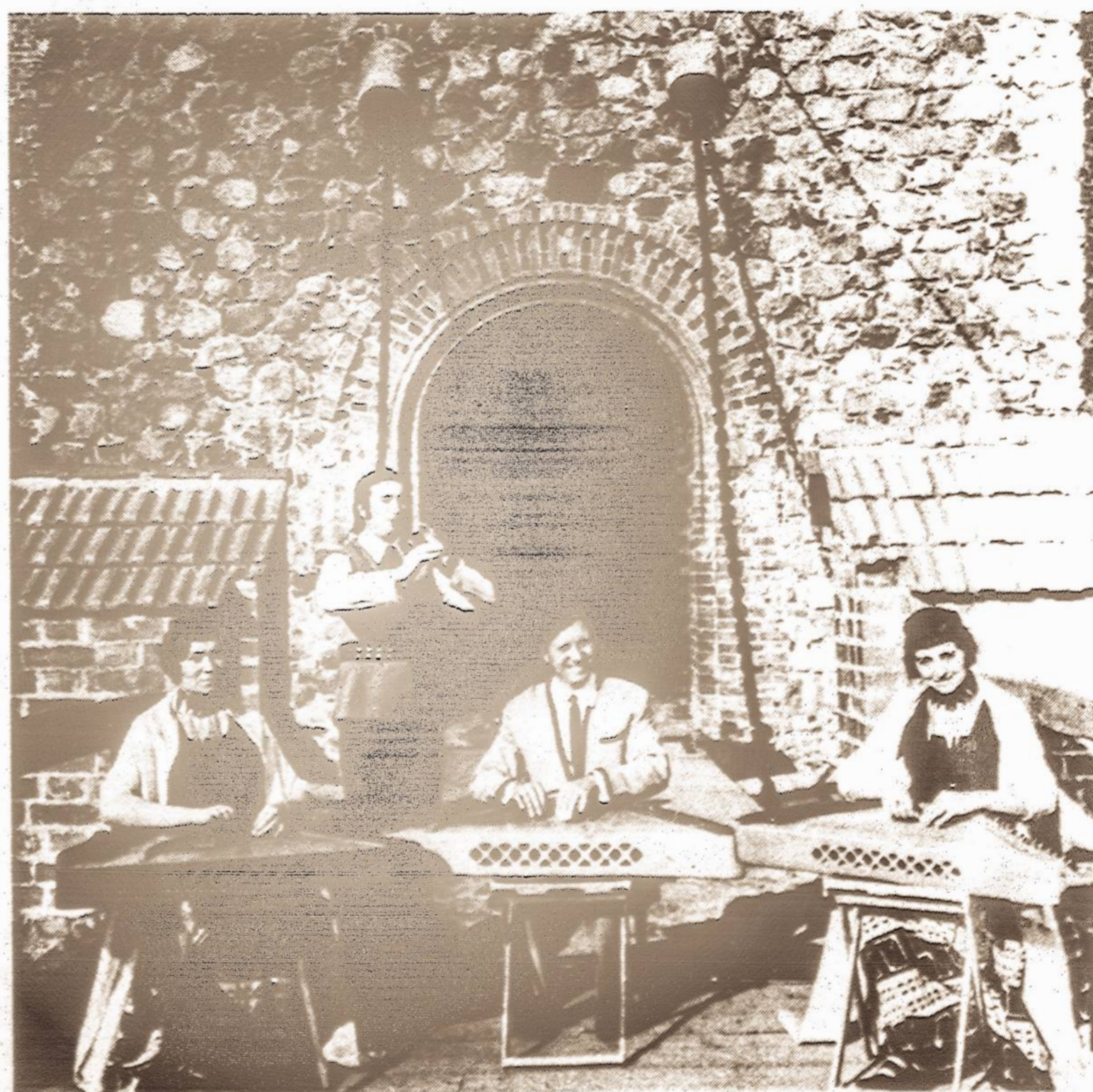
A traditional Sunday afternoon concert in ancient castle of Trakai, a resort near Vilnius. The quartet is performing on native folk instruments, the kanklės and a flute.