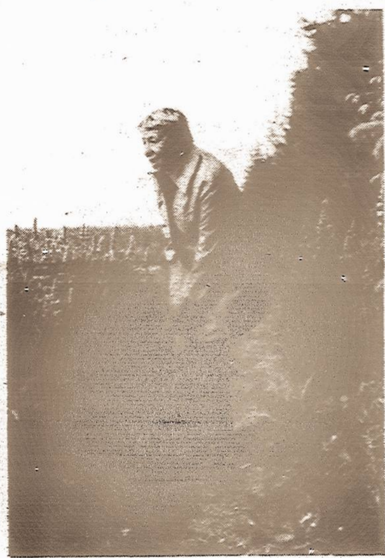
Amidst magnificent Alaskan wild flowers. . .

The Captive Nations Week Committee of New York is chaired by Judge Matthew J. Troy. It includes member organizations from more than sixteen captive nations including Albania, Bulgaria, Byelorussia, China, Cossackia, Croatia, Cuba, East Germany, Estonia, Georgia, Hungary, Latvia, Lithuania, Romania, Slovakia and Ukraine. Other members include such American groups as the Catholic War Veterans, the American Legion and various political and civic groups.