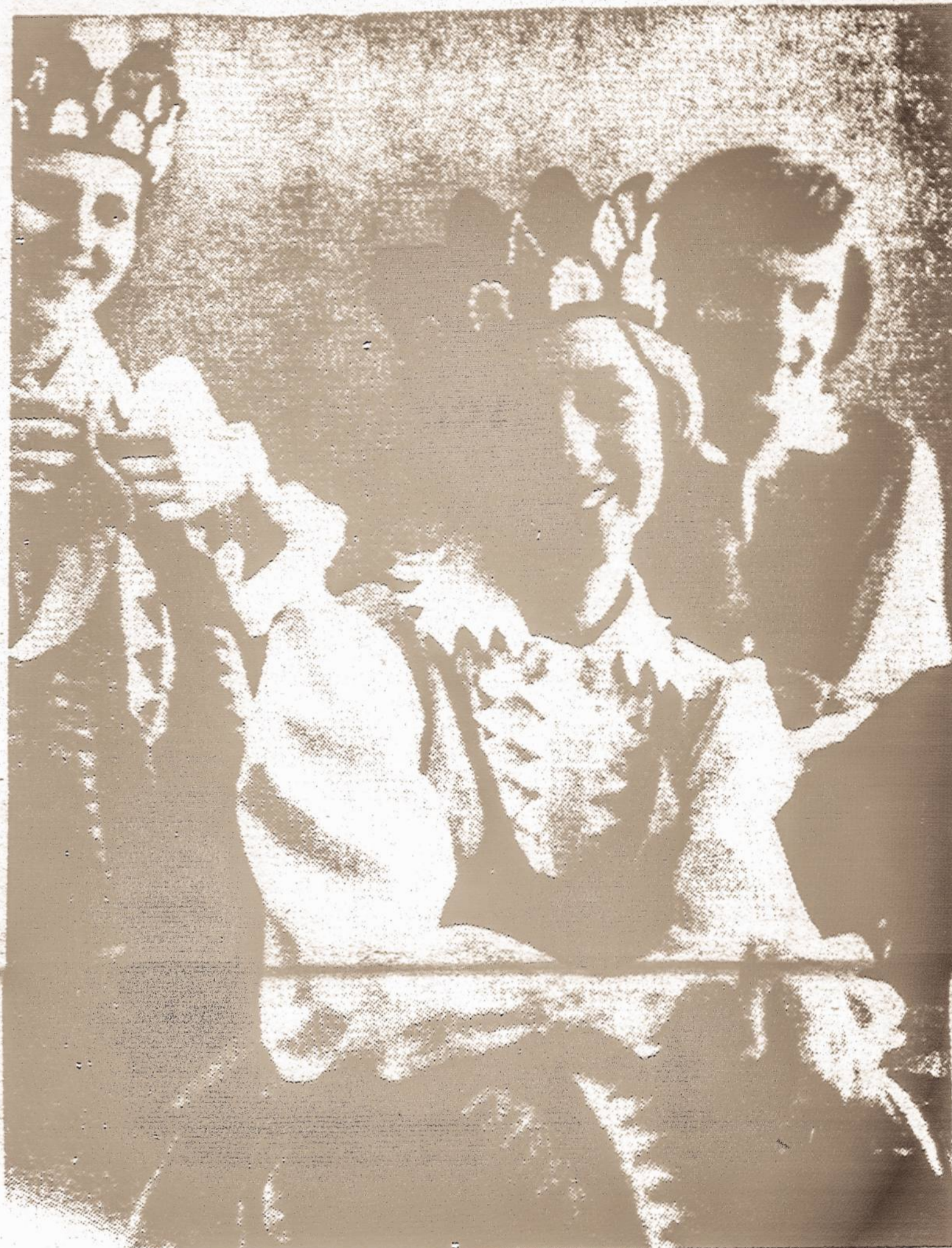
1975 m. Lietuvos dainų šventės dalyviai naujuose, tautiškuose rūbuose.