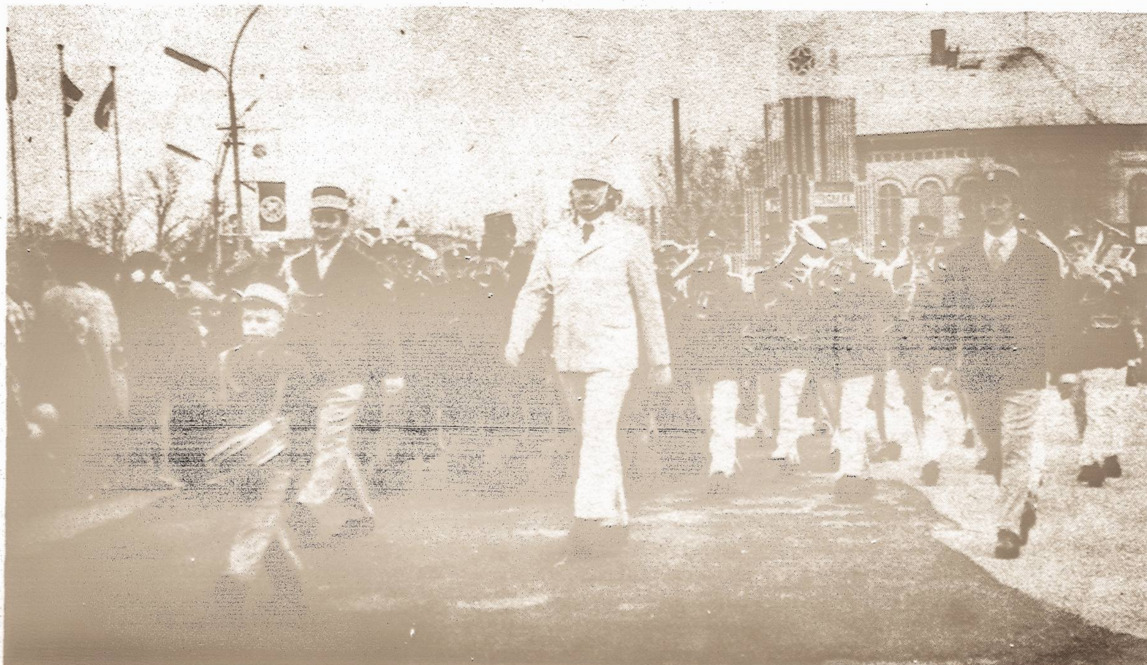
Į Dainų šventę žygiuoja jungtinis orkestras.

Kur Vilniaus mūrai, Vilniaus bokštai, Kur amžių nuotaika gyva, Tautų draugystės, džiaugsmo puokštę Į saulę kelia Lietuva!