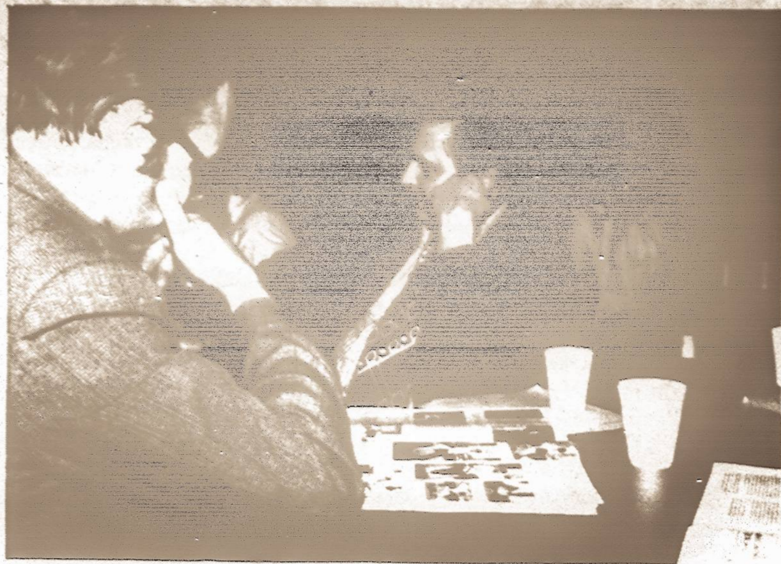
Tipiškas vaizdas iš Jaunimo Centro kultūrinių vakaronių, kurios penktadienių vakarais sutraukdavo po šimtinę ar daugiau tautiečių. Kava, vynas ir spauda pajvairindavo tų vakaronių programą.