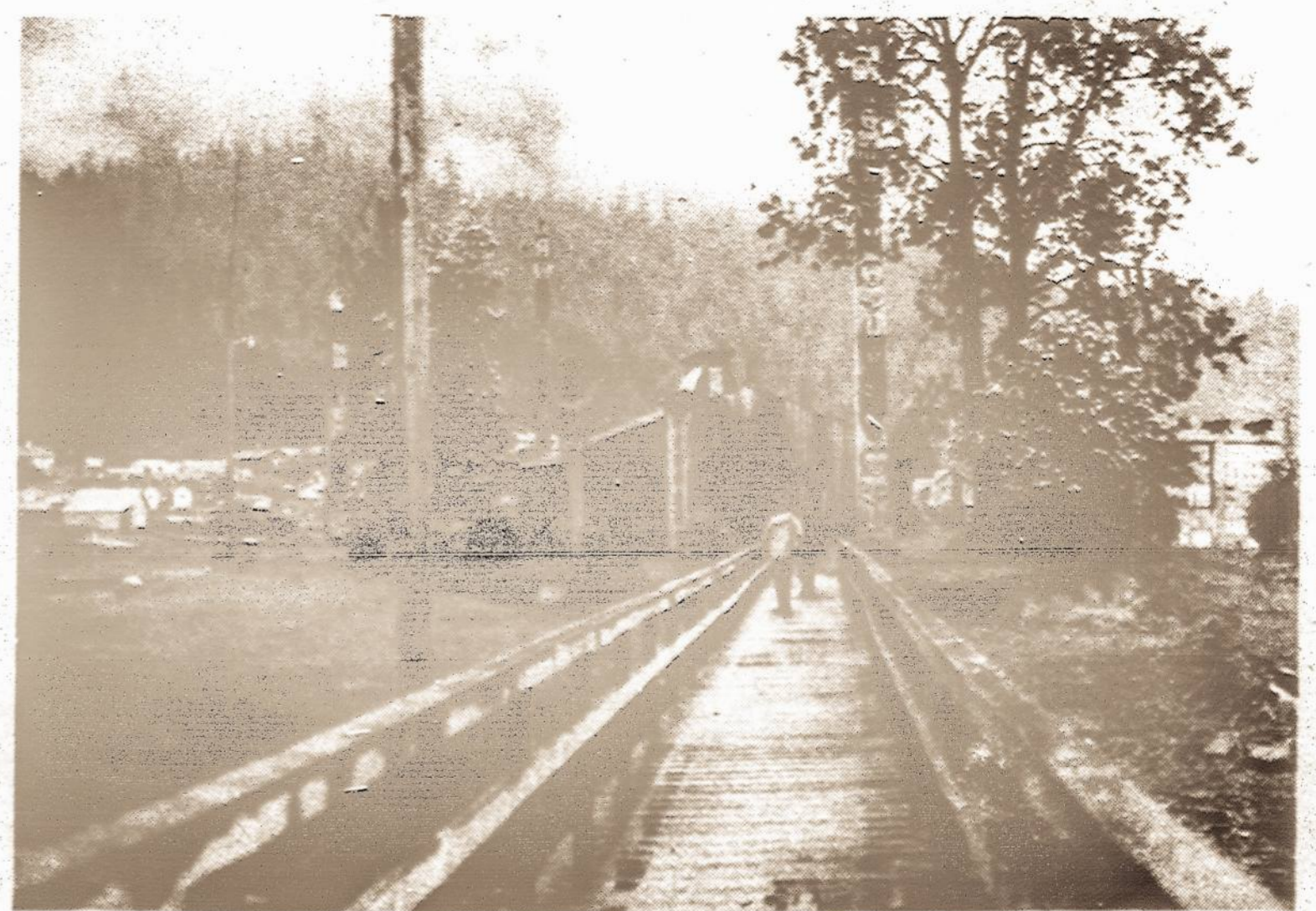
A Tlingit Indian community with numerous totem poles.