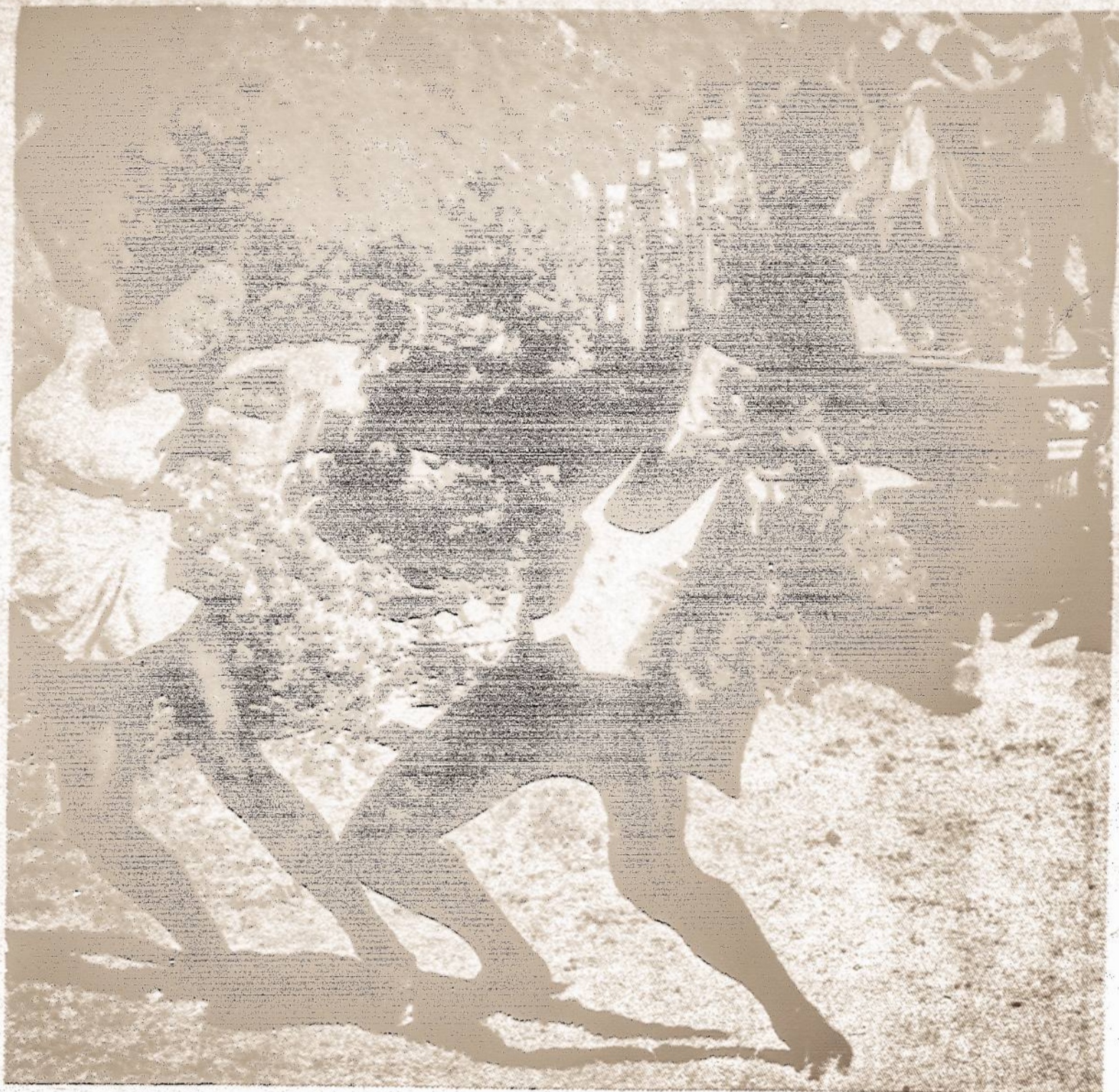
Vaidas iš pirmosios Lietuvos Kino Studijos spalvoto muzikinio filmo "Velnio Nuotaka". Filmas bus rodomas 3 Pennies Cinema Kino Teatre, Chicagoje, sekmadienį, sausio 23 d., 2:30 val. p. p.

Mokykloje veikia lietuvių "Rūtos" ratelis. Didžiulėje mokyklos bibliotekoje specialus kambarys yra skirtas lietuviškoms knygoms.