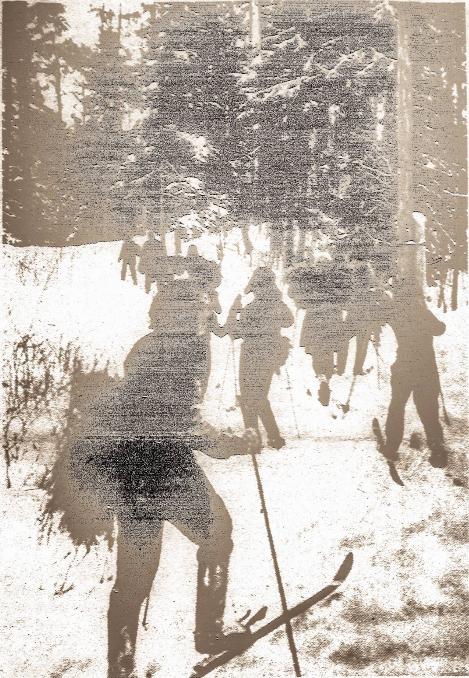
Žiema Lietuvoje. Ten, kaip ir čia, slidinėjimas yra mėgiamiausias žiemos sportas.