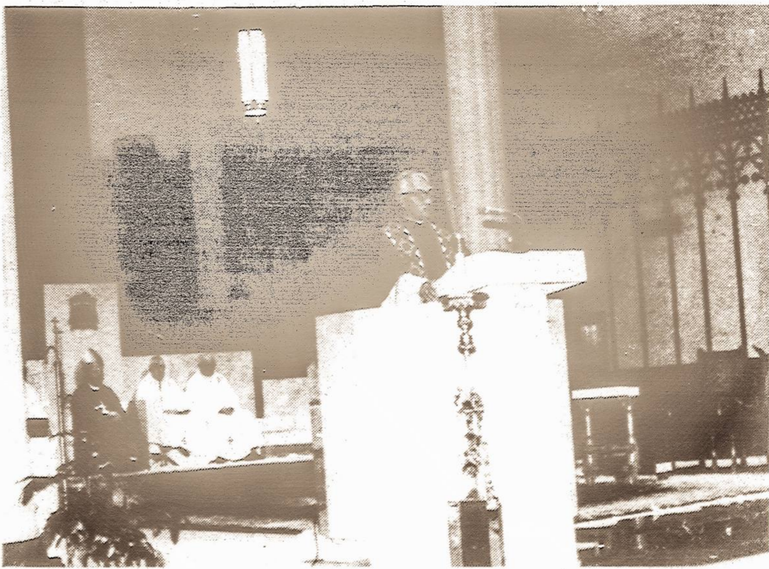
Clevelando katedroje vyks. A. Deksnys.