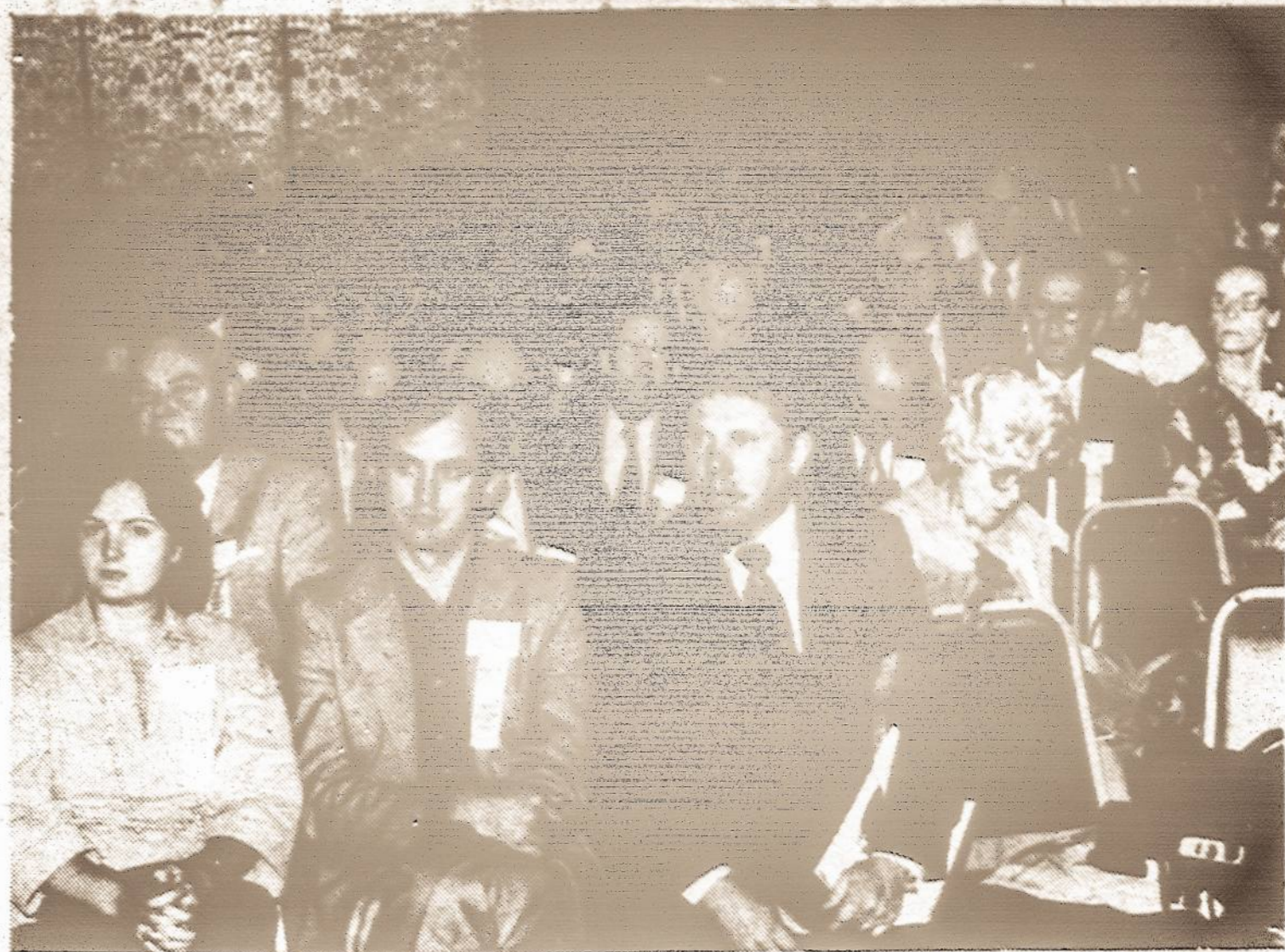
Dalis publikos Kongrese.