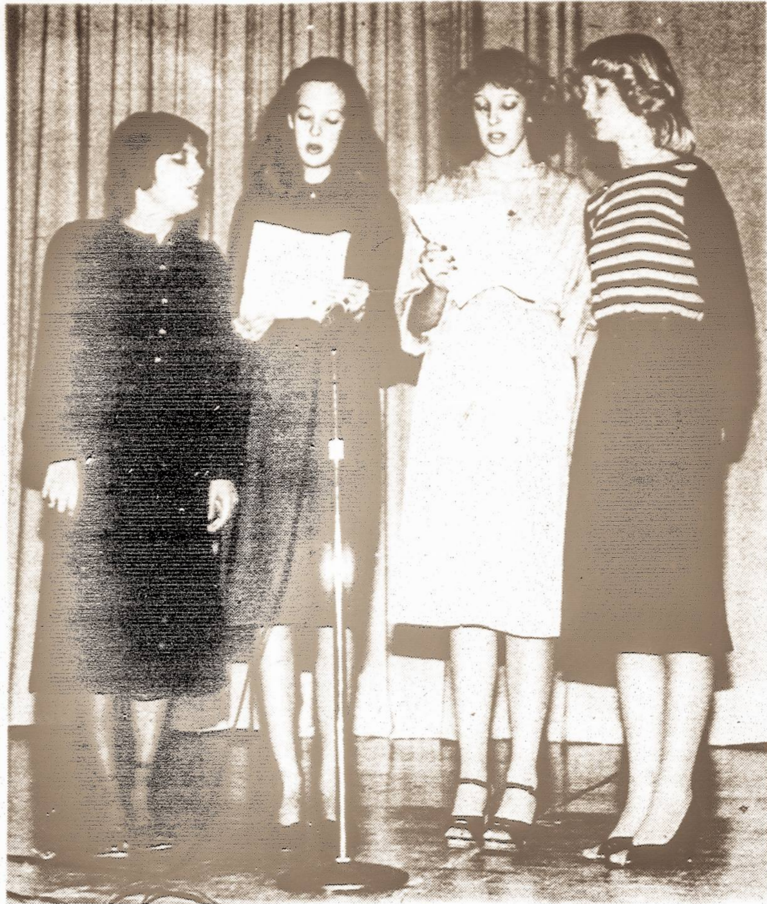
Detroito skautų ir skaučių veiklos 30-čio paminėjime viešios iš Chicagos atlieka dalį meninės programos.