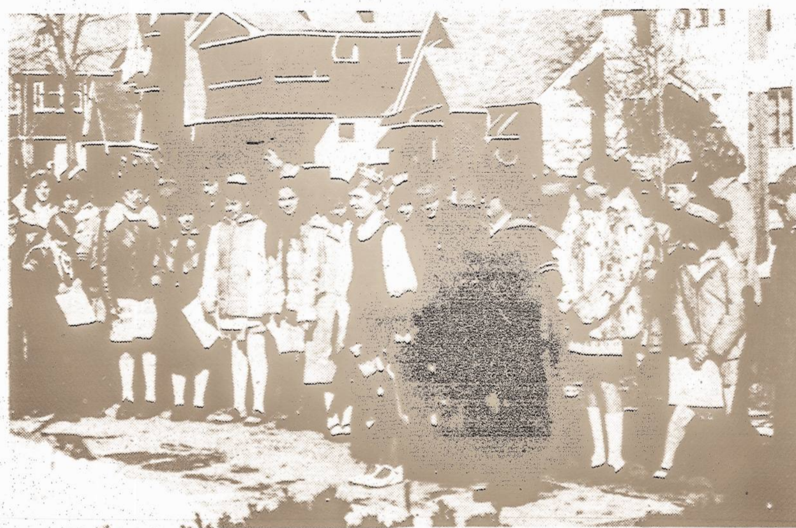
Vasario 16 d. proga Clevelando Šv. Kazimiero Lituanistinės mokyklos mokiniai prie laisvės paminklo padeda vainiką.