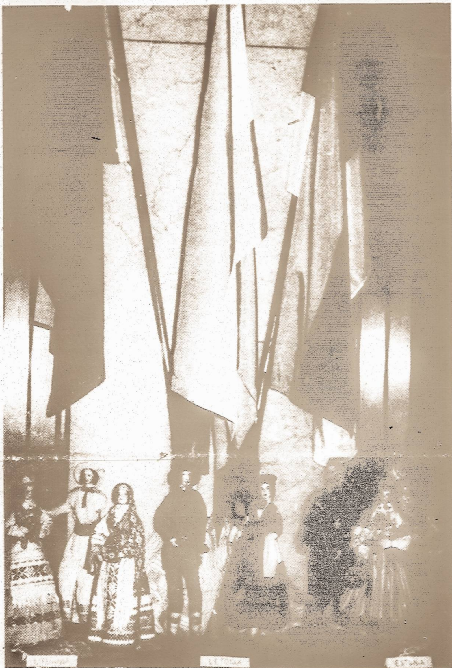
Estu, latvių ir lietuvių liaudies meno paroda, pernai buvo suruošta Buenos Aires, Argentinoje, Kanados banko patalpose.