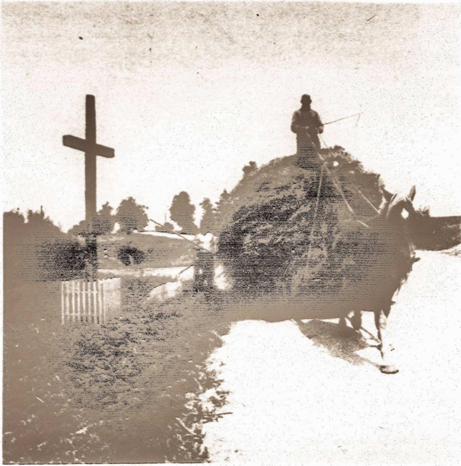
Pakelės kryžius praleidžia šieno vežėjus Veiviržėnų vietovėje Lietuvoje šiuo metų vasarą.