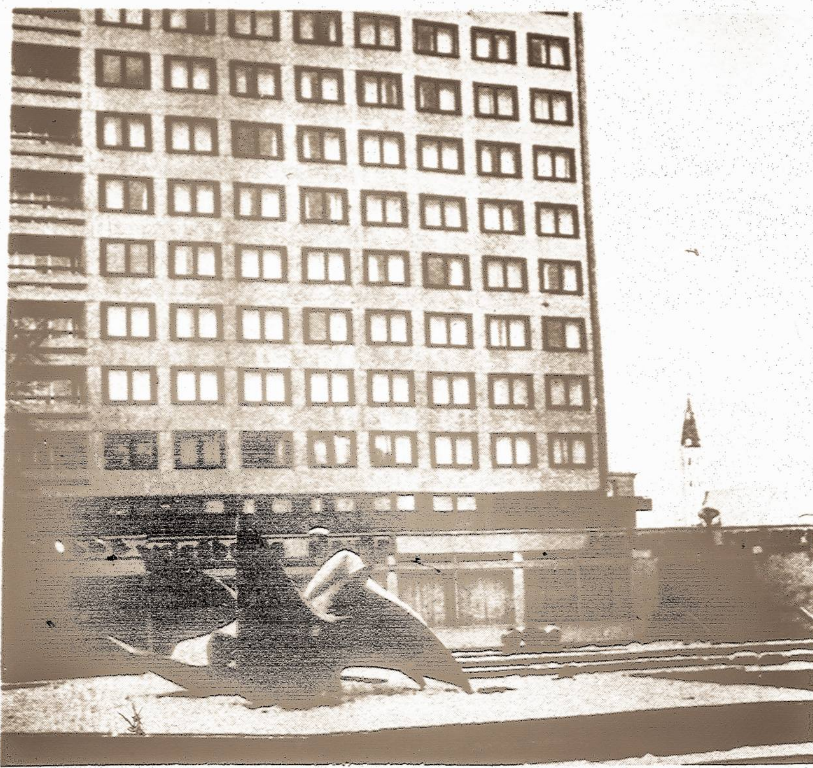
Siaulių miestas, kaip ir daugumas Lietuvos miestų, gerokai padidėjo, išgražėjo. Čia moderniškas viešbutis su restoranu "Siauliai".

Profsajungos rūpinasi ir savo narių gerbūviu bei jų darbo sąlygomis. Visas Baltijos pajūrys apsta-