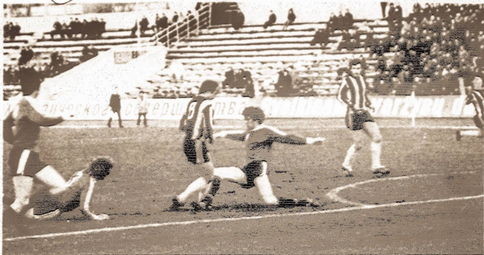
Vilniaus "Žalgirio" futbolininkai [dryžais marškinėliais] Vilniuje žaidžia prieš Zaporožės "Metalurgo" vienuolikę. Vilniečiai dabar pateko į TSRS aukščiausiąją futbolo lygą.