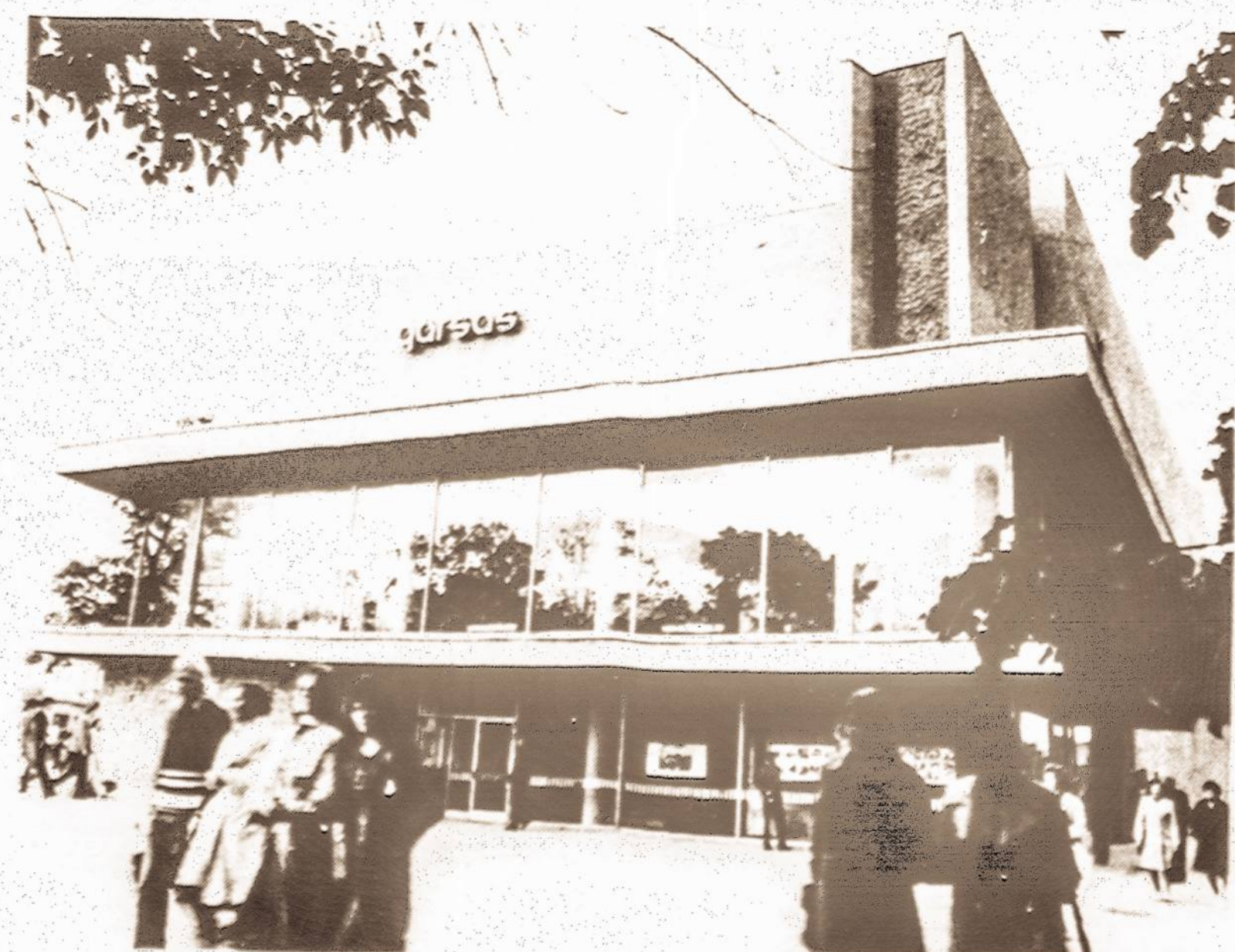
Panevėžys yra vienas didesniųjų Lietuvos miestų su daugeliu naujų pastatų. —Panevėžio kino teatro „Garsas“ pastatas.

Taip netikėtai pasibaigė didžiojo aušrininko ir Lietuvai pasišventusio dr. Jono Šliūpo audringas gyvenimas. Urna su jo pelenais jo šeimos parvežta į Ameriką ir šiuo metu ilsisi Chicagoje, laisvoje Amerikos žemėje, kurioje jis gyvas būdamas tiek daug darbuos Lietuvos ir lietuvių gerovei.