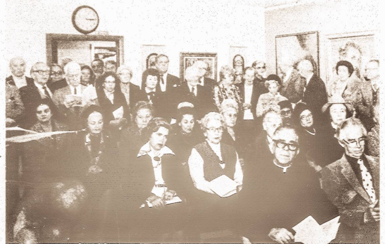
Dalis publikos, minint Čiurlionio galerijos, Inc., 25 metų sukaktį Midland Savings Banko patalpose gruodžio 19 d.