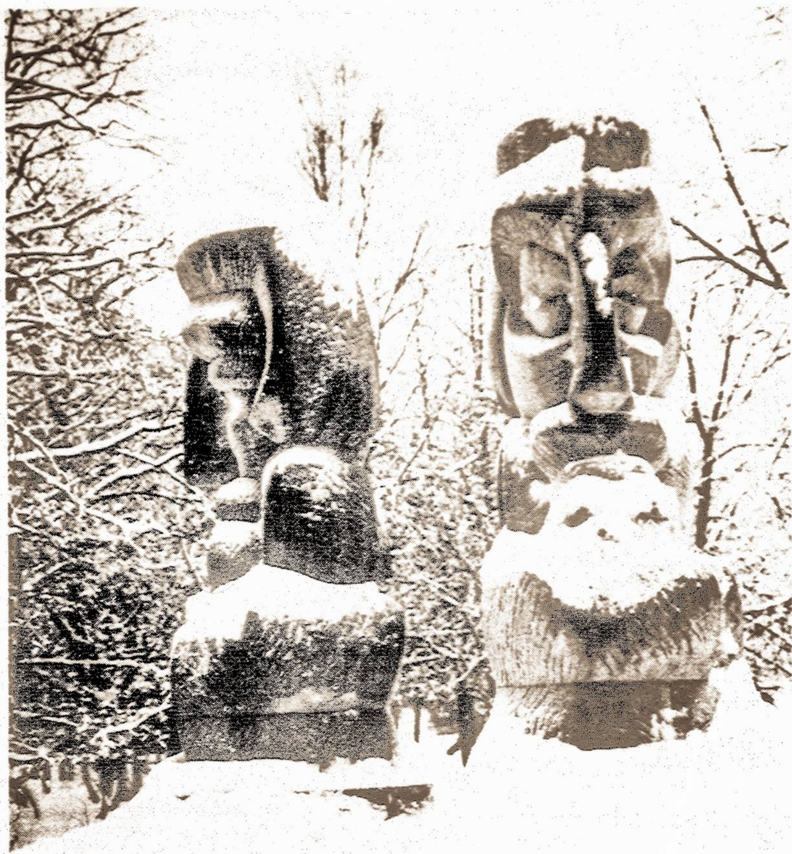
Sniego patalų apklotos ilsisi skulptūros Vilniaus Gedimino kalno papėdėje.