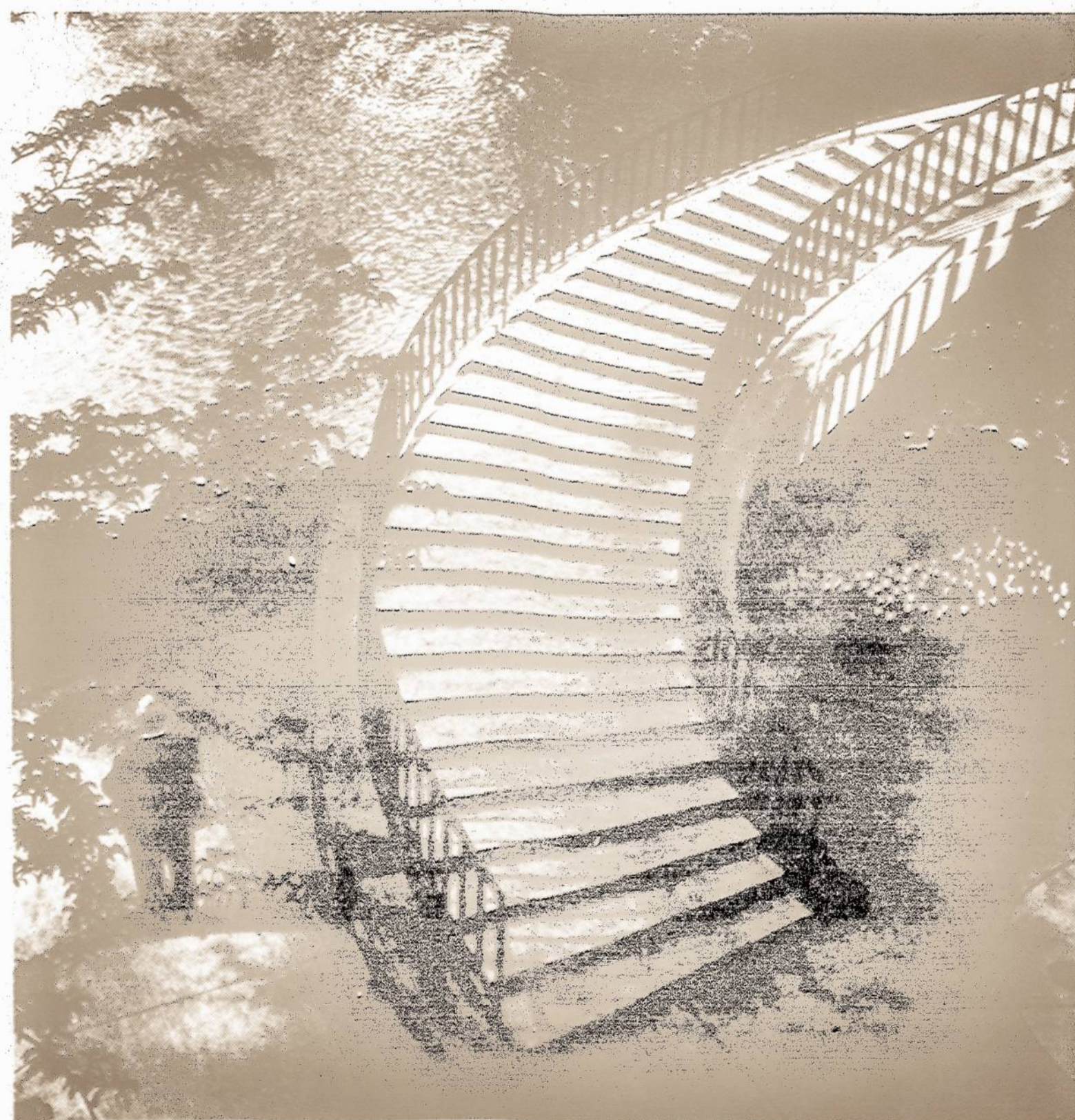
Chicagos upė prie Michigan Ave. 1966