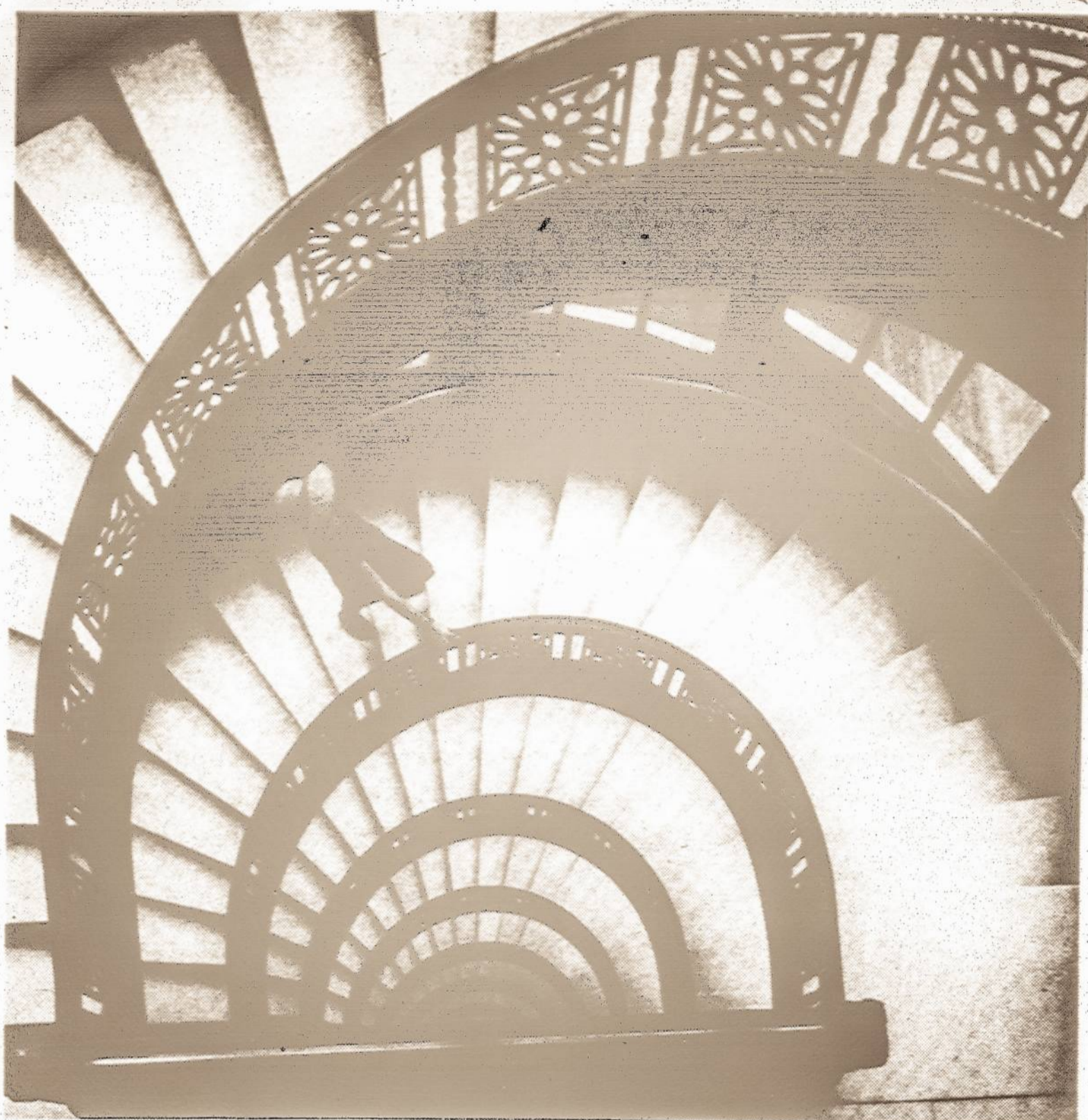
Chicagos "Rookery", 209 S. LaSalle Street 1967.