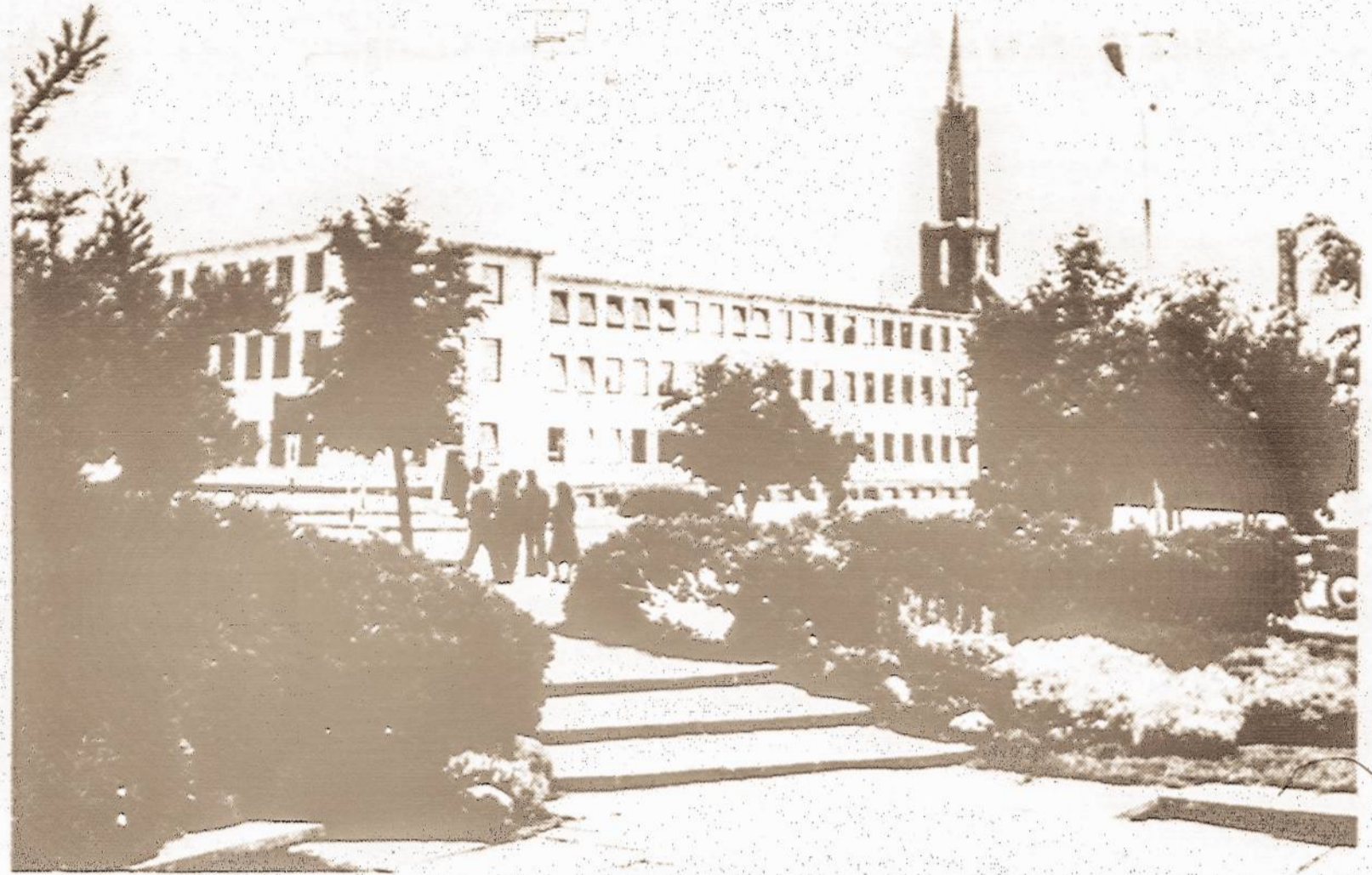
Taip dabar atrodo Kaišiadorių miesto centras.