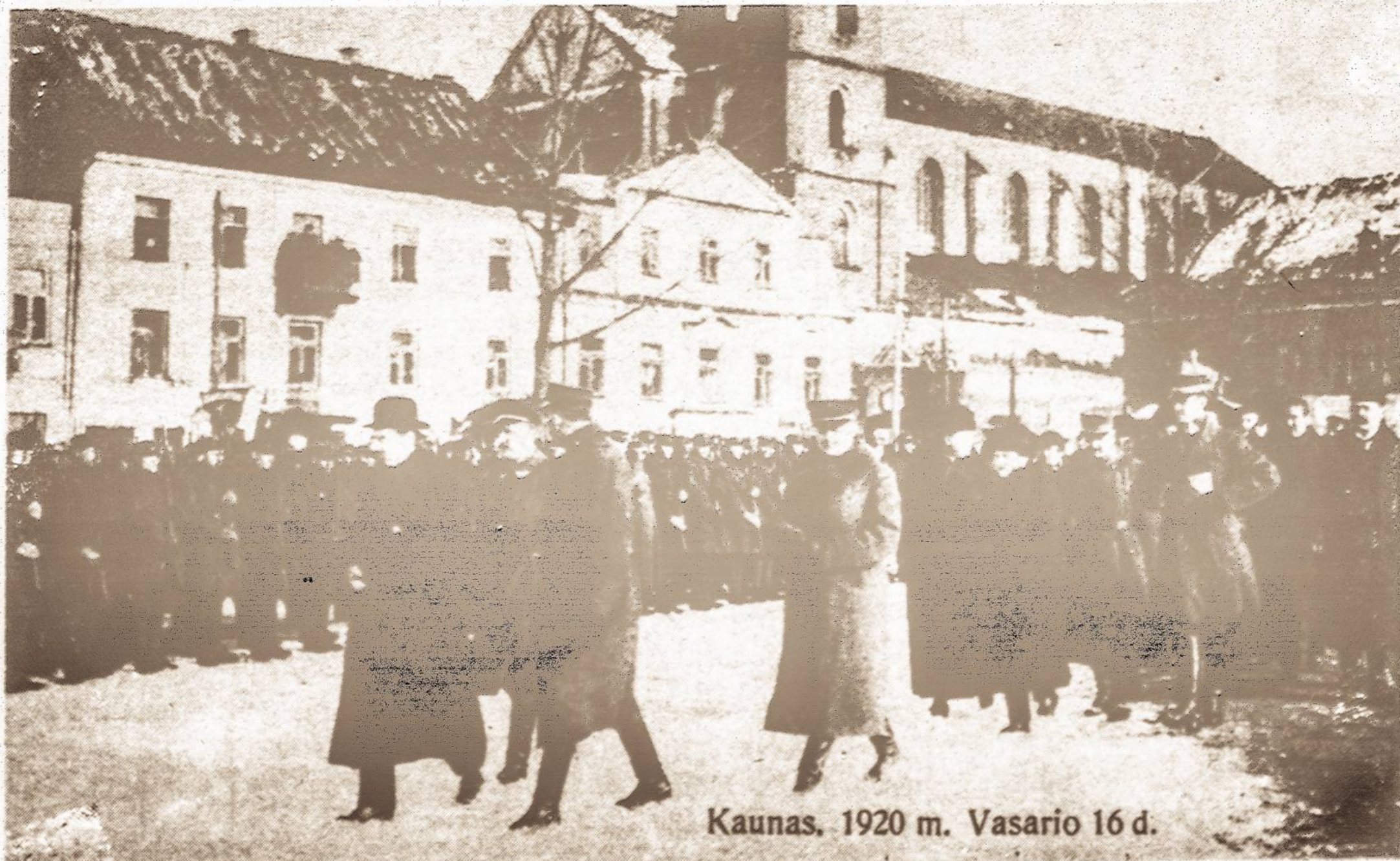
Kaunas, 1920 m. Vasario 16 d.

Šv. Jurgio parapijoj Mišios už kovojančius dėl Lietuvos laisvės bus atnašaujamos vasario 16 d., 7:30 val. r.