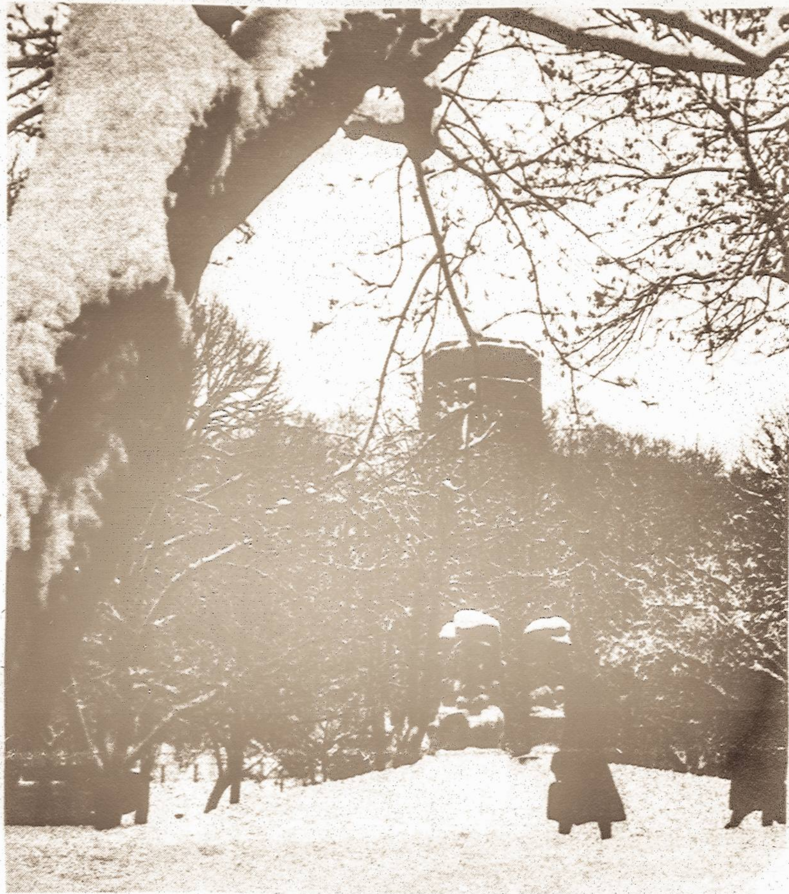
Gedimino aikštė Lietuvos sostinėje Vilniuje, 1983 m.

Pennsylvania, Massachusetts, New York ir kitų valstijų bei miestų vyriausybės gubernatoriai ir mērai Vasario 16-ąją vis paskelbia Lietuvos nepriklausomybės diena.