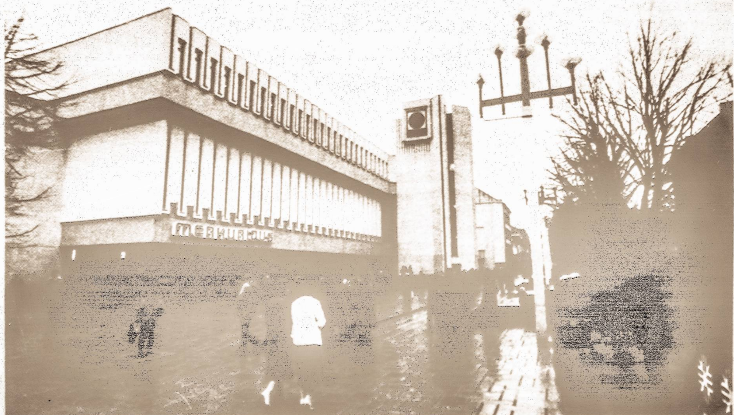
Merkurijaus vardu pavadinta pati naujausia Kauno Laisvės alėjoje įsikūrusi universalinė parduotuvė.