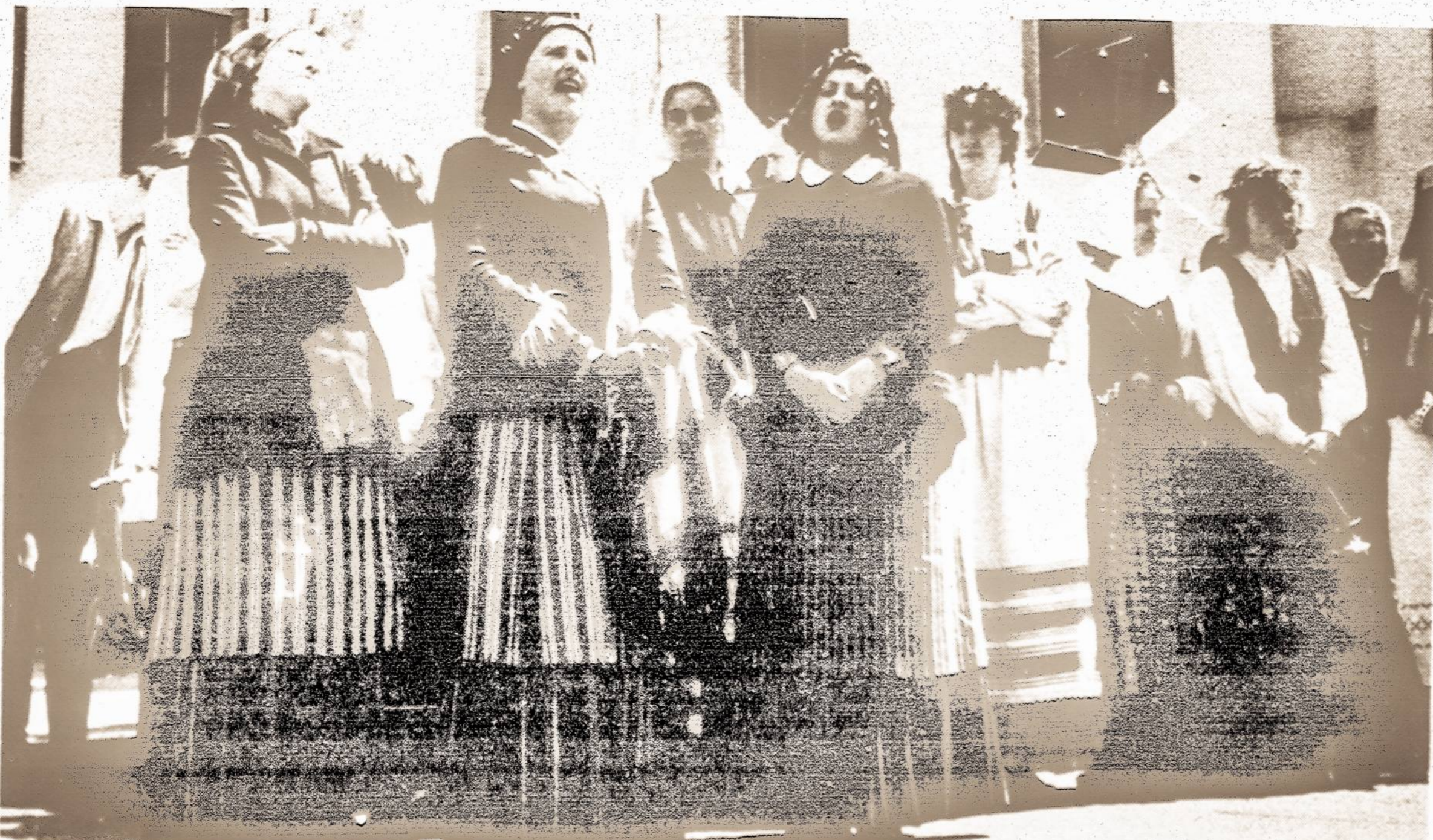
Dainuoja Vilniaus universiteto folklorinis ansamblis.