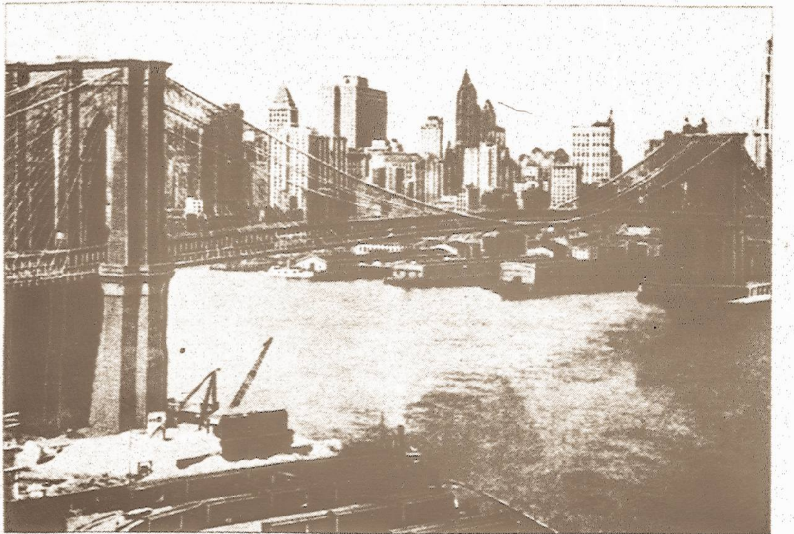
O štai Brooklyn tiltas po šimto metų, su taip įprastu fonu — New Yorko dangoraižiais, kur išikūrė pasaulio prekybos centrą.