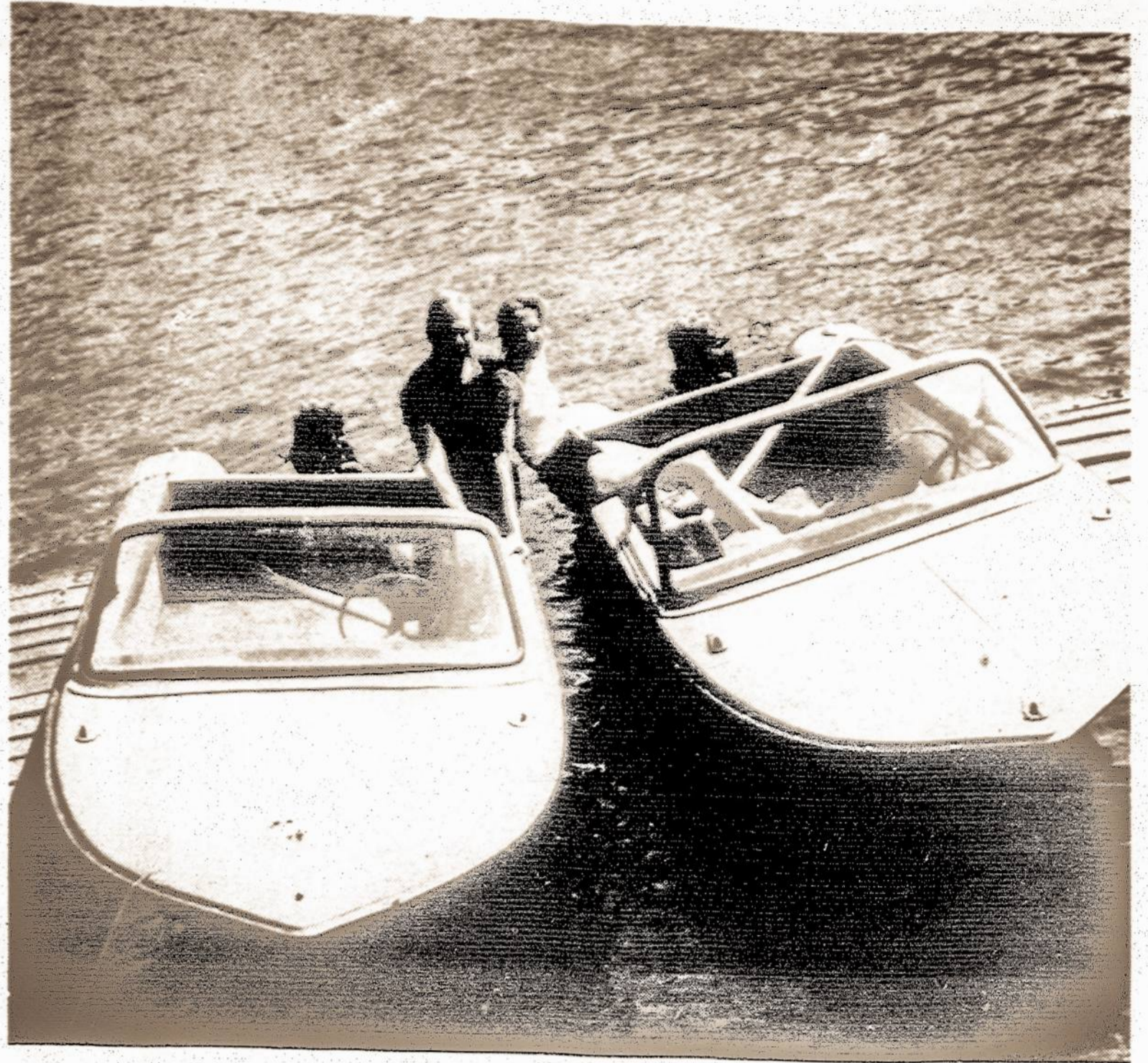
Smagu buvo vasarą motorinių valčių sporto mėgėjams Nemune prie Birštono.

Tačiau krentant Gerulaičio pasirodymų kokybei aikštėje, gerėja jo sugebėjimai . . . muzikoje. Laikraščiuose ir žurnaluose matome jo nuotraukų su gitara rankose. World Tennis žurnalas rašo, jog Gerulaitį, o taip pat ir kai kurias kitas teniso "žvaigždes" galima rasti New Yorke "Heartbreak" naktiniame klube Varick gatvėje.