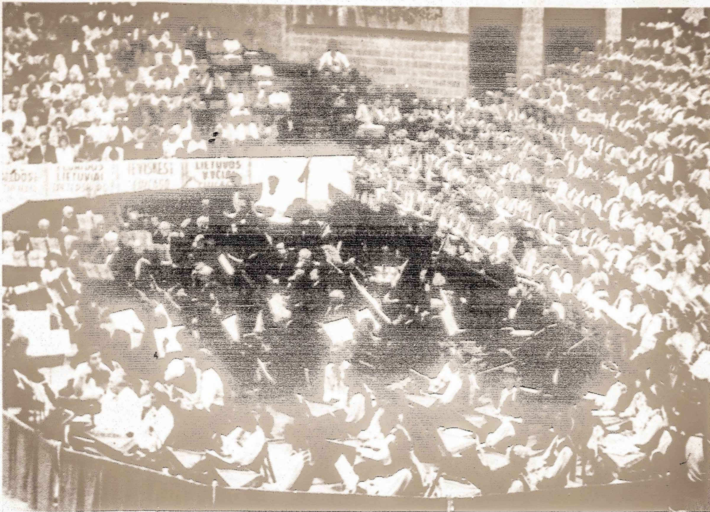
Bendras vaizdas iš Šeštosios Dainų šventės Chicagoje: dalis choristų ir publikos.