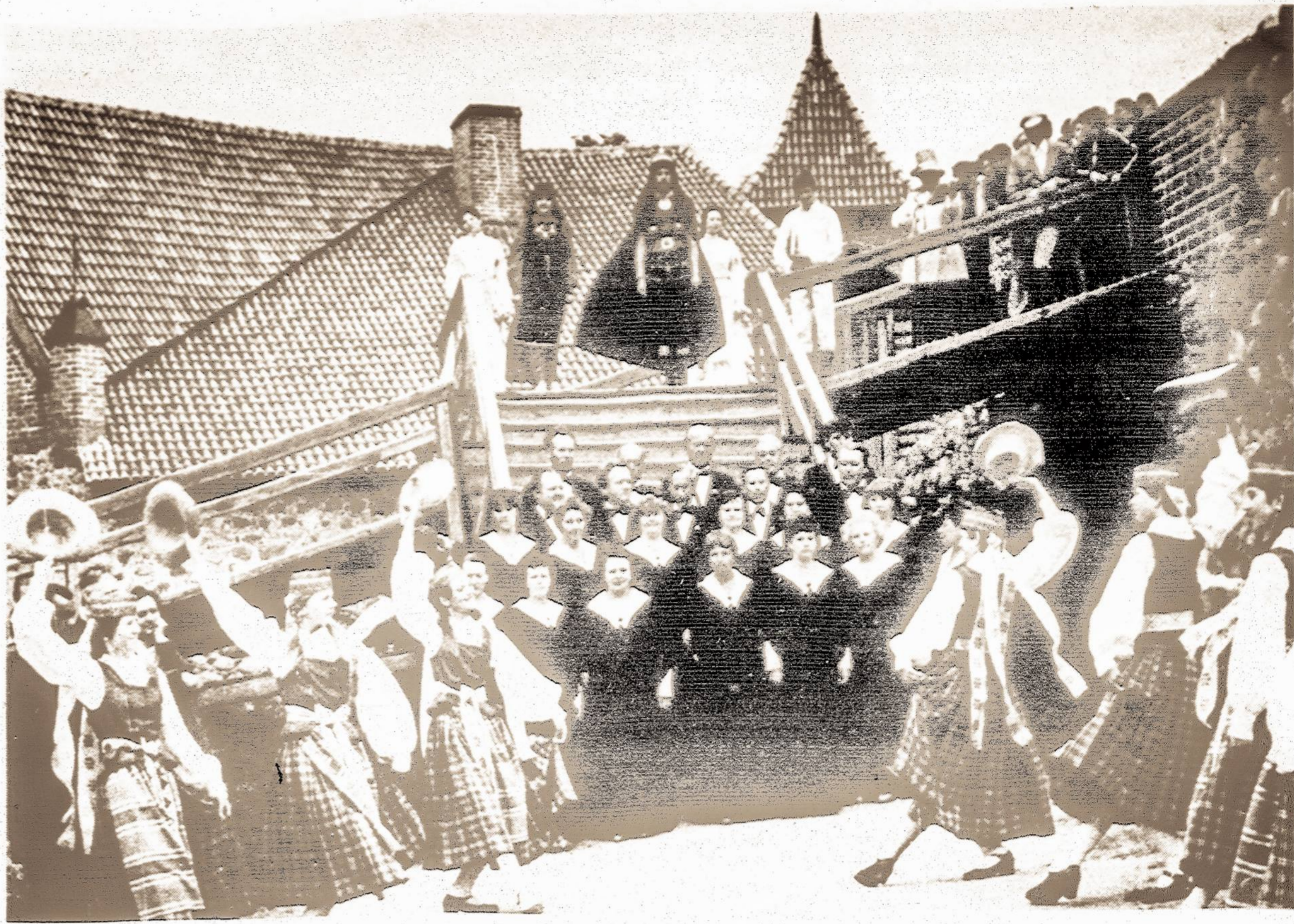
Liaudies meno šventė Trakų pilyje. Nuotraukoje matyti šeimininkai — kunigaikštis su kunigaikštine,