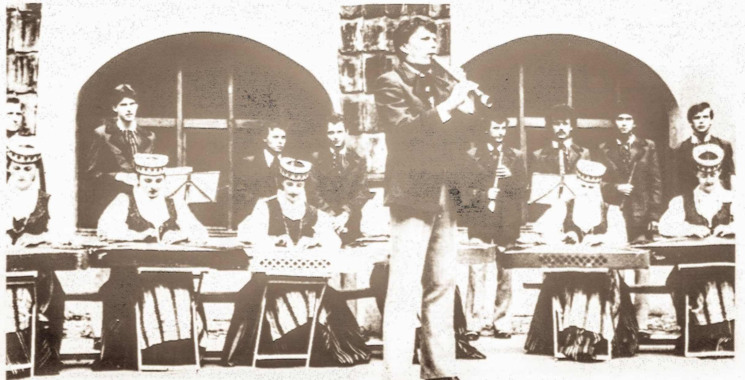
Vilniaus universiteto kanklininkės ir birbyninkai.