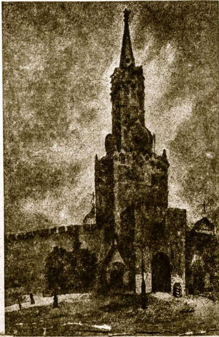
Spaskoe vartai iš Raudonojo Plečiaus į Kremliną.