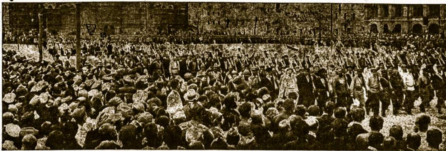
Maskvos darbininkų ginkluota demonstracija.