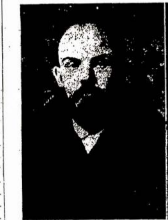
N. Lenino paveikslai, buvę caro policijos rankose. ("Soviet Russia Pictorial")

Antro kongreso manifeste pasisako, jog: "Komunistų Internacionalas yra tarptautinio proletariato revoliucijos partija. Jis nušluoja šalin visas tas organizacijas ir grupes, kurios prigaudinėja proletariata atvirai arba prisidengdamos, kurios klupdo proletariata prieš stabus, pridengiančius buržuazijos diktatura, prieš tokius stabus, kaip teisėtumas, demokracija, šalies gynimas ir tt.