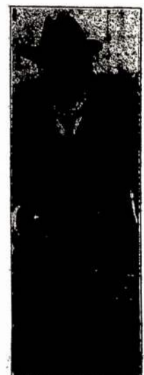
C. RAKOVSKIS Rusu Ambasadorius Anglijoj.

"Vilnies" vajas jau baigiasi ir jeigu tik mūsų kareiviai laikys savo pozicijas iki galo, kaip kad iki šiol laikė, tai vajas bus pilnai