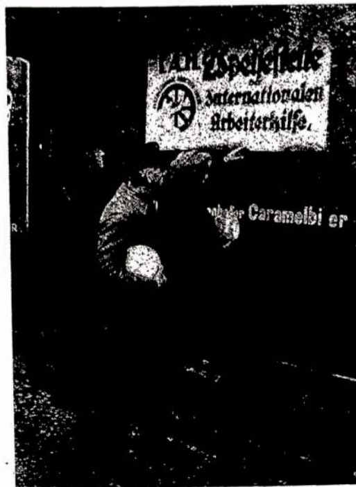
Darbininkų uždėta virtuvė Berline, kurios palaikymui chiegiečiai turi "Tag Day", 9 kovo. (Iš "Soviet Russia Pictorial")

Dresden. — Saksonijos seime (landtage) monarkistai atstovai užpuolė komunistus ir spėka išmetė juos iš seimo posėdžio. Triukšmas kilo del begėdiško vidaus reikalų ministerio elpencijos. Centralinių In-