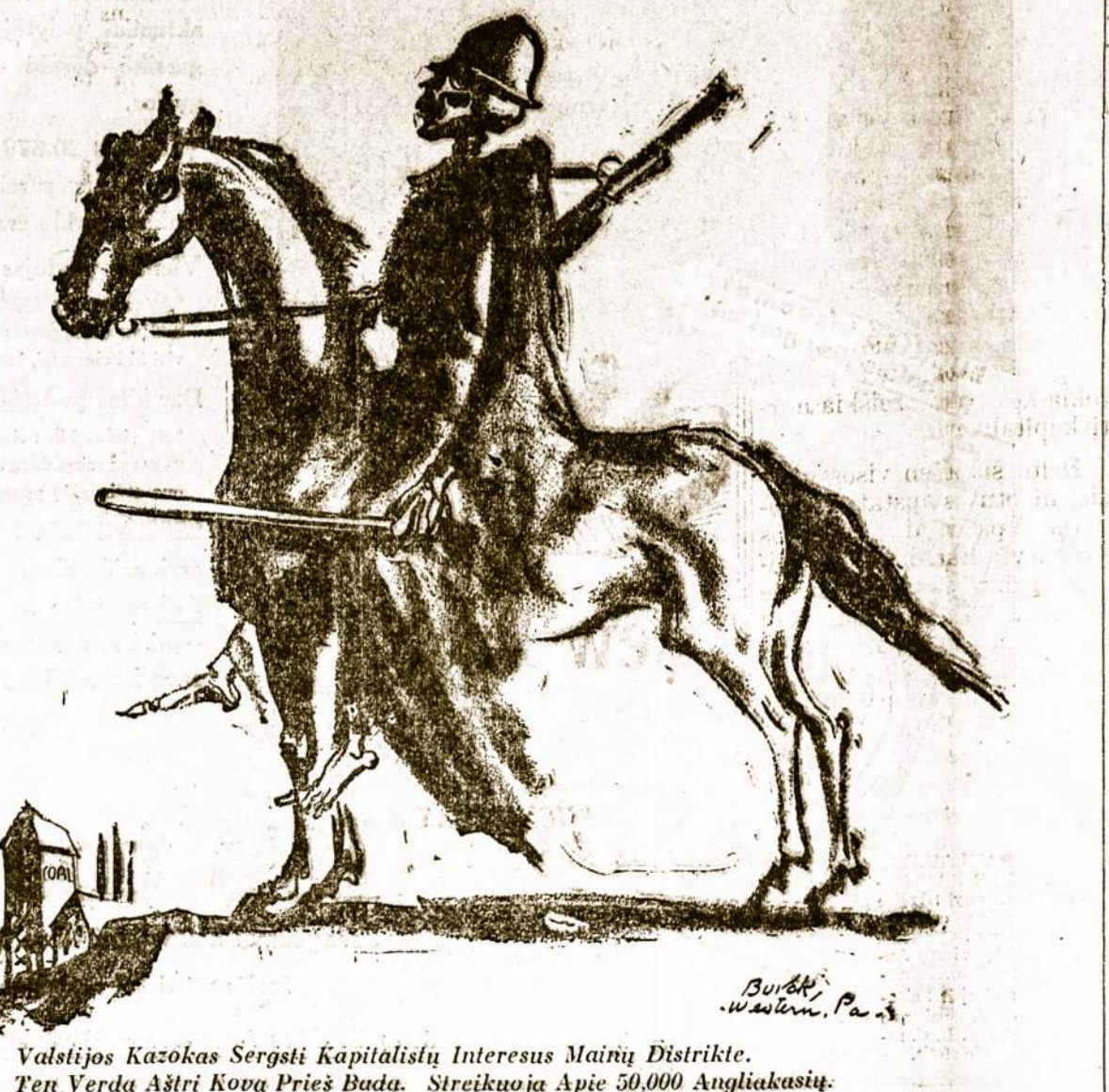
Valstijos Kazokas Sergsti Kapitalistų Interesus Mainių Distrikte. Ten Verda Aštri Kova Prieš Badą. Streikuoja Apie 50,000 Angliakasių.