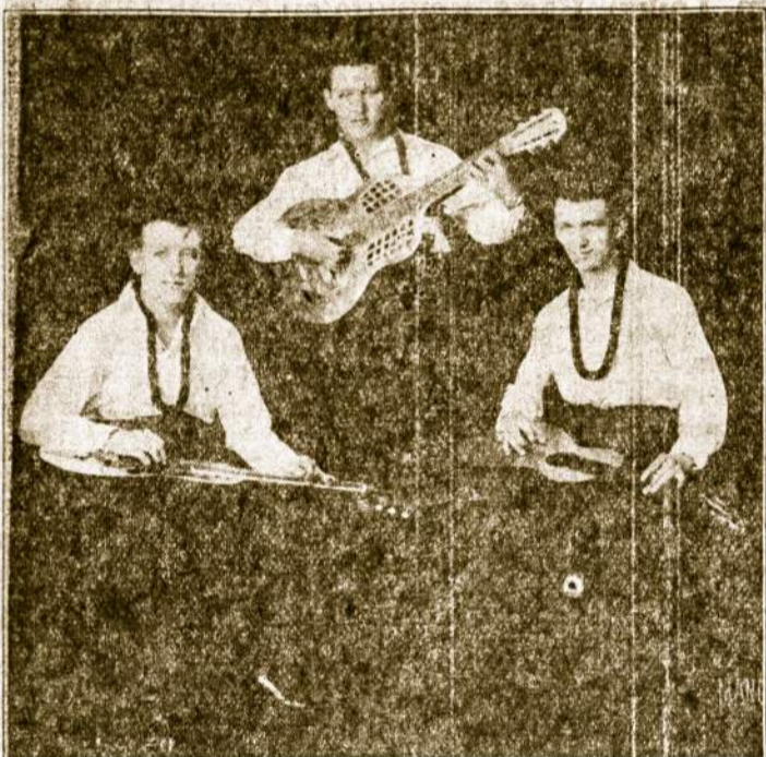
Kenstavičių Gitarų Trio.

Svetaines durys atsidarys 3 val. po pietų