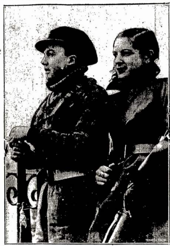
Du jauni Ispanijos respublikos gynėjai pasiruošia frontan prieš fašistų Tokių tautos žiedų, pasirengusių gyvastimis apginti liaudies ir šalies laisvę, neretai dabar tenka Madrido gatvėse užsieniečiams pamatyti.

Tai tie patys esą orlaiviai, kurie aną savaitę dėl blogo oro buvo nusileidę Francijos žemė. Bet kiti 15 orlaivių atremdami nazių lakunus sveiki pasiekė Bilbao.