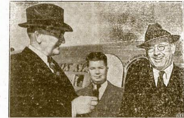
Dešinėj paveikslu pusėj Alf. Landon, reaktininkų buvęs prezidentinis kandidatas. Aš irgi mano, kad reikia Amerikos valstybėm vienytis prieš fašistinius agresorius. Atvaizdas imtas jam gzytant iš Pan-Amerikų kongreso.

Sausio 7 d. senoji Balčiaus direktorija atsisaitydino.