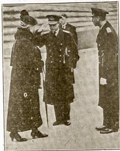
Įsimaisęs "karališkas kraujas" sugadino karališką Anglijos valdovų šeiminą. Susirgus Anglijos karaliaus motinai, čia kalbos, kad išstremtas suns Edwardas atvyks iš Francijos jų atlankyti. Edwardas, kaip žinoma, apsiėvė su amerikiete Mrs. Stimson ir ne tik neteko karunos, bet ir iš tėvynės tapo išstremtas už tai, kad "suteršė karališką kraują". Šis atvaizdas nutrauktas dar Edwardui tebekaraliaujant. Čia matome buvusį Anglijos karalių salutuojant savo senę motiną.