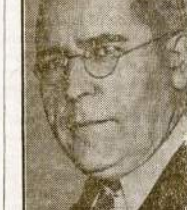
David L. Lawrence, stambus Pensilvanijos politikierius, pagautas grafte ir bus teisiamas.