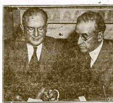
KOKIA LIKIMO IRONIA! Kada kongresas sumažino Rooseveltto reikalaujamą WPA darbam sumą ant $150,000,000, tai ty patys kongresmanai suka galvas kaip pageltinti "biednoms" geležinkelį kompanijoms. Čia matome senatorių Burton K. Wheeler ir kongresmaną Clarence F. Lea, kurie kongrese vadovauja komercijos komisijai. Jie du tai patį pagaminę bilų kongresui, kuri šiom dienom paslūsus paskirti geležinkelį kompanijom milžinišką sumą pinigų, kad išgelbėti jas iš bankruto. Mat, pastarnaisiais metais ty kompanijų šėrininkai nebegana tiek dividendų kiek gaudavo pirmiau.

Nutarta, kad apskritis pasistų ty telegramas: