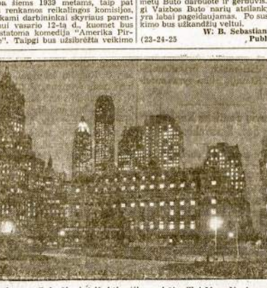
Manhattan Sala žiūrinis iš Atlantiko naktis. Tai New Yorko miestas, kurio dangoraižiai nakties laiku pasipuošia milijonais elektrinių "akų".

Minėta konferencija yra svarbi tuomi, kad bus renkamis skyriaus valdyba siems 1939 metams, taip pat bus renkamis reikalavimus komisijoms, renkamis darbininkai skyriaus parengimui vasario 12-tą d. kuomet bus perstatoma komedija "Amerika Piryke". Taigi bus uždarėta veikimo