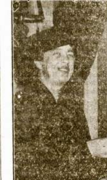
Dvi žymiausios Amerikos "Ladies", bet tik viena plačiai žinoma. Mrs. Rooseveltienė ir vice-prezidentė J. N. Garnerio žmona. Ponia Rooseveltienė yra gabi rašytoja ir prakalbininkė, kuomet Mrs. Garner... tik šlap sau "šeimininkė". Beje, juodvėjų vyrai abu vienos partijos nariai, demokratai, bet kuomet Rooseveltas yra pažangus demokratas, tai Garner bene pats aršiausias reakcininkas ir nei kiek nesiskiria nuo Hooverinų republikonų.

Iki pat mustynių palaigos autobusas su plungiškiais eiskur-