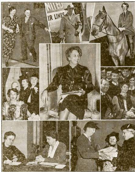
IR KUR JI TIEK ENERGIJOS IMA? Mrs. Rooseveltienė, prezidento Rooseveltto žmona, bene bus viena iš darbiausiųjų tos klesos moterų Jungtinėse Valstijose. Ji rašo įvairius laikraščius ir žurnalus, sako prakalbas ir atliko įvairius pareigumus plačioje Amerikoje; dažnai kalba per radio. Neseniai Dr. Gallup prarastame konkurse ji pripažinta populiariausia moteris Amerikoje. Štai keli vaizdeliai paveikluose iš ponios Rooseveltienės aktyvistikos. Skaitant nuo viršaus iš kairės: šoka "kadrijų" WPA darbininkų surengtame bankiete Arturthdale, W. Va.; išlipa iš orlaivio atskridusi tolimą kelionę, kad pasėdėti prištūti ir laiką ir pasakyti prakalbas; dalyvauja arklų parodoje Fort Myer, Va.; atidaro vaju už sukėlimą aukų pagėbiam vaikų paralyžium sergantiems; priima Teisų Doktoro diplomą John Marshall Kolegijoje; diktuoja atakumus į tuksandžius laiškus, kurios jis garba kasdien; atsilankiusi į aklyj WPA projektą New York'e kalbasi su neregėm darbininkėm; ištikrujū tai stebėtinose energijos moteriškė, kuri jau nebe jauna, nes senai išaukėjęs šeimynų ir jau yra "Grandma".