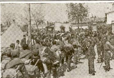
Infantry leaves Barcelona in preparation for the defense of surrounding country.