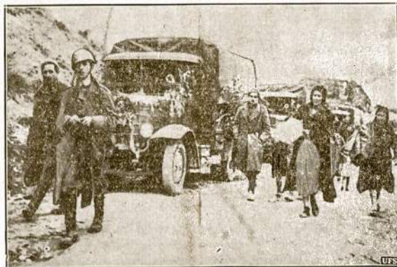
Kur fašistai ir italai artėja, iš ten civiliai gyventojai bėga. Atvaizde matyti moterys ir vaikai, padedami kareivių, kraustosi iš Castelland miestelio, Katalonijos fronte. Nes fašistai užėmė miestą ar kaimą, daug žmonių išžudo.