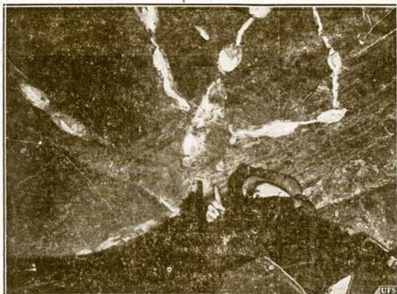
Šis gvyumas gyveno šimtus tūkstančių metų pirmą "pasaulio sutvėrimo". Štai at- vaizdas, kurį atidengė užgrūvus uolos šmotas Black Diamond kompanijos ang- lių kasykloj, netoli Renton, Wash. Atski- lės uolos šmotas atidengė pėsakus miži- niško paukščio, kuris gyvenes ant šios žemės gal milijonai metų atgal. Jo pėda buvo 42 colių ilgio ir 36 colius pločio. Dabar mokslininkai tiria tos apiepinkės žemės sluoksnius gal suras ir suakmenėjusius graucius to įdomaus "sutvėrimo".

Aišku, kad j tai veikia gy- ventojų prieaugis, bet taip- gi gvyai veikia ir žmonių amžiaus ilgėjimas.