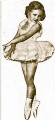
Viena jauna šokikė iš aukščia-minėtos šokių mokyklos.

Ši mokykla yra žinoma Chi-cagoje kaip viena iš pirmiečių, kuri yra davusi pasaulinai pasi-žymėjusių šokių.