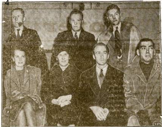
Išgėti iš jūrų bangų didžiojo Anglijos keivinio orlaivio "Cavalier" pasazieriai, k 10 iš 13 keleivių tapo išgelbėti, kadkadžiūlis orlaivis sudužo nukrisdamas Atlantiką. Juos išgelbėjo laivas "Eso Boytown", kai jie jau buvo išbuvę vandenyj visų naktį. Trys keleiviai žuvo bangose. Sis atvaizdas nuotrauktas, kai laivas "Eso Boytown" atplaukė į New Yorko uostą.