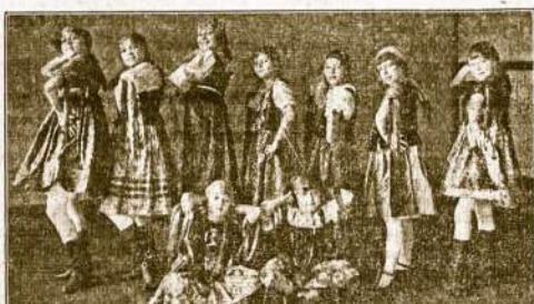
Comicoff Baletu Mokyklos Sokių Grupė Kviečia ALDLD Pirmas ir LDS Antras Apkričiai.