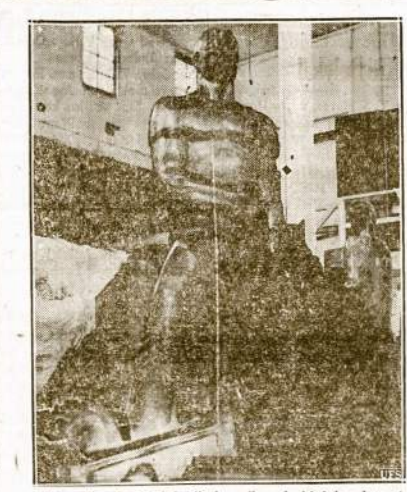
"Amerikos Darbininkas". Amerikos darbininkas bus atvaizduojamas pasaulinėje parodoje, New Yorke šioje statulyje, kurią neseniai nulijo skulptorius Glen Holland, New Yorke. Statula nulietas iš misinio įvairių metalų ir mineralų ir labai panaši stiklui. Ji bus viena iš 12 statuly, kurios atvaizduos Amerikos darbininkų industrijos.

DĖLEI GYNIMO LIETUVOS NEPRIKLAUSOMYBES Konferencija griežiausiai