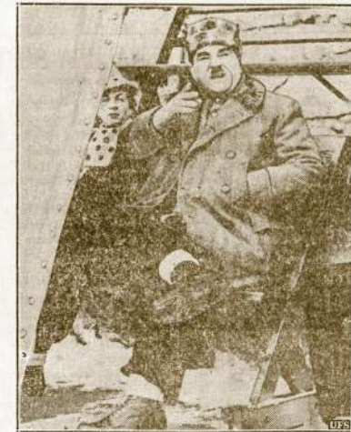
Šis žmogus suka Jugoslaviją linkui Berlyno-Romos ašies. Tai Jugoslavijos premieras Milan Stojadinovič, kuris čia matomas ką tik atvykęs į Alpu kalnų, Šveicarijoj. Neva žiemos sporto dėdė atvykęs į St. Moritz, Stojadinovič pasiuntė su Hitlerio agentais ir turėjo slapčius pastarinius.