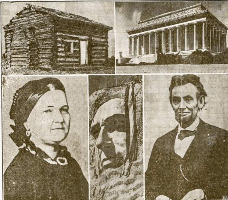
RYTOJ, VASARIO 12 DIENĄ, sukanka lygiai 130 metų kaip gimė garšiusis kovotojas už negrų laisvę ir abelnai demokratiją Abraham Lincoln. Jis gimė vasario 12 d., 1809 metais, netašytų rąstų lušnoje, arti Hodgenville, Kentucky. Lušna, kurioje gimė šešioliktasis Jungtinių Valstijų prezidentas parodoma kaizriame kampe šio atvaizdo. Dešinėj pusėj matomas Lincoln'o paminklas Washingtono. Apačioj, dešinėj atvaizdas Lincoln'o žmonos Mary Todd; viduryj Lincoln'o galvos skulptura iš