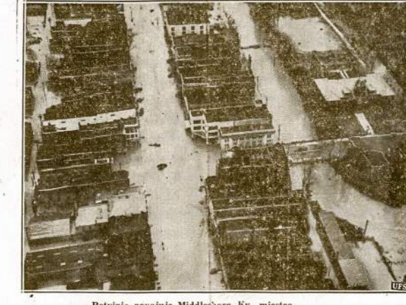
Potvinio pavojuje Middlesboro, Ky., miestas.

Darbo Federacijos Pildomoj Taryba žaidžia ugnim, reikalaujama pakeičiant Wagnerio Akte. Ji susidrieja su toriais. Štai prie ko prieina žmonės, kurie vaduojasi frakcinu apjakiu prieš CIO!