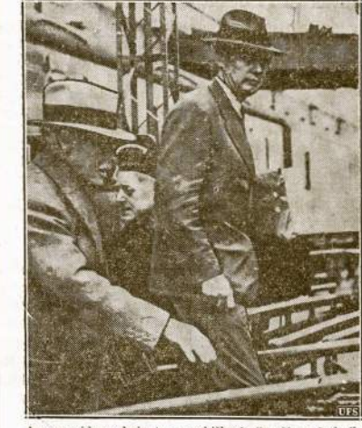
Ar nepasidarys kaip tas pasakiskias "amžinas žydas". Štai kadaise buvęs garsus lakunas Charles Lindbergh, kai jis sugryžė iš Berlyno į Francija. Berlyne ponas Lindbergh tiek pasitaravo Hitleriui, kad jis tą buvusį lakuną apdovanojo tokia nazišku garbės ženkle, kokio nėra gavęs jokis kitas svetimšalis hitlerininkas.