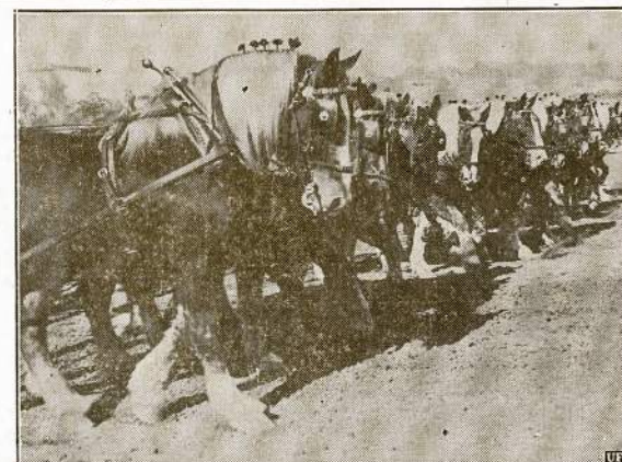
Žmonės nenorėtų tikėti, kad stambieji belgu veislių arkliai galėtų būti panaudoti lenktynėse. Bet štai visai kaimež jį garsiajam Santa Anita arklių lenktynių lauke, Californijoje. Tiesa, jais lenktyniavo, bet tik išdrapakavo lenktynių kelivą tikriesiem bėgkam. Arklių lenktynėse žmonės pralošia dešimtis milijonų dolerių kas metai, nors lažybos Amerikoj įstatymais uždrausta.