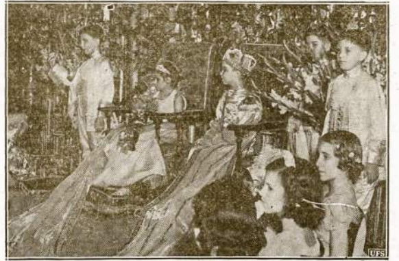
Išdykėliai neturėdami ko geresnio veikti, nors ir demokratinės respublikos piliečiais budami, bet žaidžia "karaliumi" ir "karalienes". Štai paveliklas neseniai įvykusios mugsės New Orleans, La. čia matome Louisiana gubernatoriaus sūnų par-

Bus kasdien įdomūs programos ir gera muzika šokiams. Nepamirškite nuo dabar pradėti ruošti prie šio didžiulio bazaro. Bus daug vertingų dovanų prie įžangos tikietų.