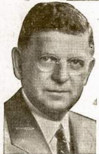
Mayor Edward J. Kelly