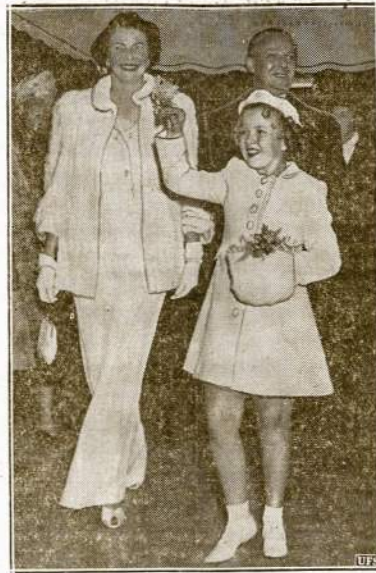
Garsioji judžių aktorė Shirley Temple jau "samgusi mergina", ji neseniai minėjo dešimtas gimtųjų sukaktuves. Čia ja matome su tėvais beinančią judžių teatrą Hollywood, kur buvo pirmu kartu rodomas jos judis "The Little Princess". Atsimenate, tai ši mergelėle pernai kongresmanas Dies apšaukė "komuniste". Dabar jau ir pats to gėdijasi ir sako, jog tai buvo "klaidą".

Kalbamas įstatymas nusako 25 centus minimumo užmokesčio valandų ir 40 valandų maksimumo darbo savaitę. Įstatymo administracijos skundu, kompanija dar vis tebemoka darbininkam po apie 19 centų valandį ir nebeturai nuslystos darbo valandų normos.