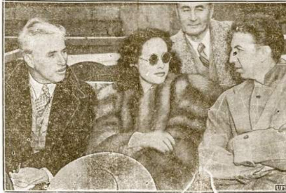
Šis šviesaus veido vyrškis (kairėje) yra ruošia naują filmą, kurioje bus išnuokta Charlie Chaplin. Šiomis dienomis jau sukako 50 metų amžius. Paskilbęs artistas