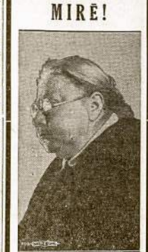
Nadėzda Konstantinova Krupskaja Lenino Našle

"Vilnės" metinis bazaras įvyks kovo 30 ir balandžio 1 ir 2 dienomis. Chiegties moterų jau pasigaminti pasidarbova gražius pagamindamos bazarui gražius rankdarbius ir parinkdamos aukų pas prielankius bėznierius. Tą gal ir privalo padaryti "Vilnės" skaitytojs nežyruti kur jos gyvena.