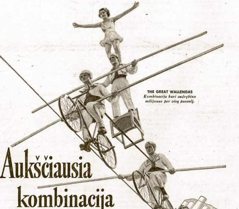
THE GREAT WALLENDAS Kombinacija kuri sudregino milijonus per visą pasaulį.