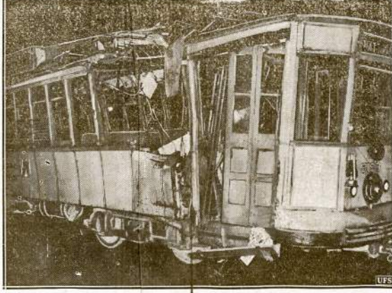
Bostono gatvekaris, kuris anue tarpū nuseko nuo bėgiū ir sunkiai atsimejē į medžius. Nelaimēj žydu penki suaugē ir vienas mūžametis. Del nelaimēs atsakominga kompanija, nes gatvekario stalidžiai buvo nuėdvēti.