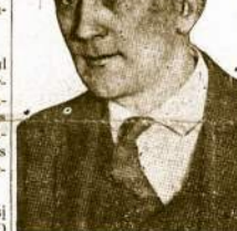
WILLIAM Z. FOSTER

Naziai veržiasi į svarbiuosius čekijos centrus.