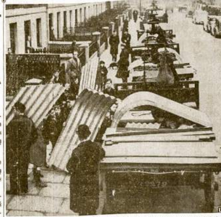
Anglijos valdžia gamina plieninę apsaugą nuo atakų iš orlaivų. Paveiksle parodo kaip tam tikri pilno šmolai sudeliojama apsaugojimui bombardavimo iš oro. Londono parkuose iškasta griovių ir urvų irgi apsaugai.

Mitingas išėjo mizernai. Naziai tikėjosi gauti daug žmonių, bet nusivylė.