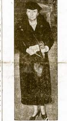
FRANCES PERKINS, Darbo Sekretorė, kuri sveikino CIO ir ADF vienybės derybų atnaujinimą.