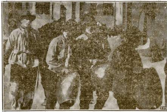
Sveicarijos "kavaleriai" švenčia pavasario tradicinę šventę. Čia matome burį vaikinių persirengusių skerdžių drabužiais ir besinesančius didelius skambalus. Jie pirma pavasario dieną išsina "vandravo!"

Tokio. — Japonų valdiška žinių agentūra Domei skelbia apie vakar įvykusį susirėmimą turpe Sovietų Sąjungos raudonarmiečių ir japonų kareivių Sovietų Sibiro ir Mandžurijos pasienyje. Domei žiniomis, raudonarmiečiai buk perėję sieną ir nužygiauč toli Mandžurijon. Raudonarmiečiai esą buvę atstumti atgal. Nuostolį nepasidarė nė vieni pusi.