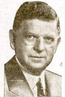
Mayor Edward J. Kelly Majoras Kelly ta proga išleido raštišką teiktumą: "Aš giliai patenkintas tokiu

Stakjardų darbininkų paančiavimas majorui yra vardų paklaidar aukščiausių organizuotų darbininkų tarpie. O jau ir be to, darbo unijos Chicago stija, kad majorų Kelly išrinkti majoru balandžio 1 dieną. —Rep.