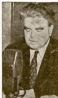
JOHN L. LEWIS

Konkio bondsai biskutį pakilo, taip ir kai kurių kitų šaltų.