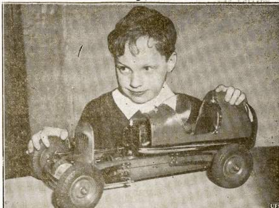
Tai bent žaisluks! Nesenai Detroito demostrota žaislinis automobiliukas, kurį šiame atvaizde matome berniuką žaiziant apsiglėbusį. Tačiau tame žaisle l-

Šią vasarą dažnai matysime tokias iškalbas pavieškeltias mūkuose. Tai automobiliams persėrgėjimas būtų atsargiems su ugnim. Kas metai miškų gaisrai padaro už milijonus dolerių nuostolių.