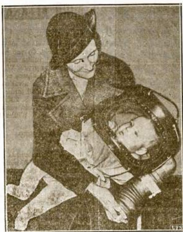
Ne nuo žvėrių motina rengiasi apsaugoti kūdikį, bet nuo tokių pat dvikojų gyvūnų kaip ir ji pati, tik pavirtusių bestijom fašistais ir besiruošiančių sukurti kitą pasaulinį karą. Tai naujusios mados apsaugoti nuo nuodingų dujų kūdikiams maskos, kurias dabar stengiasi įsigyti kiekviena motina Londone.

Quito.—Ecuadoro universitetas uždarytas iš priešties susiumšimū jame. Visi profesoriai atsiasakė.