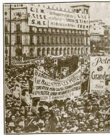
Demonstracija Mexico City mieste "Randonoj Aikštėj", paminėjimui metinių sukaktuvių atėmimo aliejaus iš svetimšalių korporacijų rankų. Nešamos iškabos sako: "Ekonominė Nepriklausomybė!" "Nė žingsnio atgal aliejaus ekspropiavime!"

Kaunas, kovo 24. — Lietuvos organizacijos nutarė nuo kovo 30 iki balandžio 2 dienos visoj Lietuvoje suruosti platų vaikų Ginklų Fondui parenti.