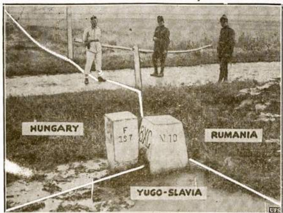
Trijų valstybių rubežiai. Ši vieta pirmą pasaulinio karo priklausė Austro-Vengrijai. Dabar dalikė rubežiuojasi net trys valstybės: Vengrija, Jugoslavija ir Rumunija. Už savaitės kitos tie rubežiai gali gerokai pasikeisti. Europos žemėlapis mainosi veik kas šeši mėnesiai ar tankiau.

Vatikanas. — Kardinolai susirūpino kur padėti popiežius atsilikime bombardavimo iš oro. mušti vidury didžiojo bokšto kambario, kurio sienos jau ir taip yra 15 pėdų storio. Jame gyvena popiežius Mykolas V. 1447—1455.