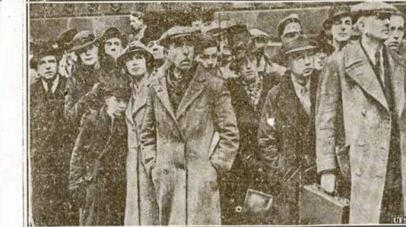
Londonė minia žmonių rupeštinaji tēmija Downing gatvė valdžios rumus, kur diplomatai kalbasi apie "bloką sulaukyti Hitlerį". Jie laukia gerų žinių.

Japonai priima, neva atsiprašo ir vėl tęsia savo barbarišką darbą — ligonbuvių ir prieglaudų bombardavimą.