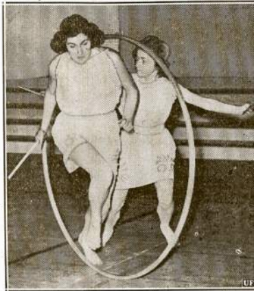
Ir Lietuvoj panašius žaislus žaisdavom, bet Amerikoj jė vadinami "Graikiški Žaislai". Čia matomos dvi Bernard Kolegijos studentės, New York, praktikuoja risti laną pavariniuose žaidimuose.

Gerbiama Delegatė: Mes, Lietuvių Moterų Seimo šaukimo komitetas šiomi siunčiam (Tąsa ant ketvirtjo puslapio)