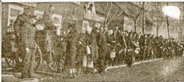
Pabėgėliai iš Klaipėdos Lietuvos Vaiko Darželių Draugijos maitinimo punkte Kretingoje.

Didžiulis Chicago lietuvių choras (LRM) buvo nulykęs