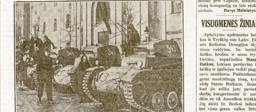
Štai ką šindien mato Čekoslovakijos sostinės Pragos gyventojai: Vokiečių kariūvus, smogikus ir plienines tankas. Tai vis "jų pačių laubai", kaip sako Hitleris. Fašistai pirmiau nuginkluvo čekus, o vėliau ir gelečizinius rėtežinius sukaustė, kad nei atsikvėpti negalėtų.

Bet ne tik kapitalizmas ir imperializmas varo propagandą prieš darbininkų šalį, bet biauri propagandą prieš tą šalį varo ir 4 mergaitės panoro likti artistais (bendrai reikėjo (Tasa ant ketviro puslapio)