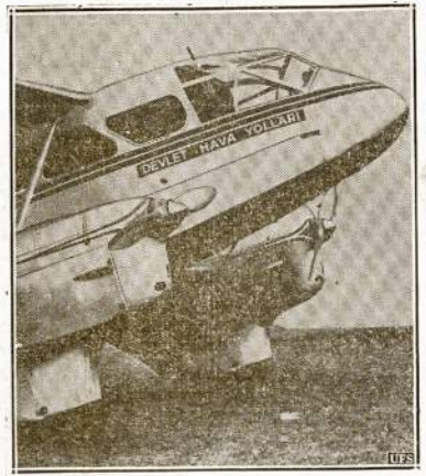
Kariniai lėktuvai Turkijai, budavojami Anglijoj. Turkija geruose santykiuose ir su Sovietų Sąjunga. Anglija anuo tarpu pažadėjo Turkijoj ginti, jeigu fašistiniai agresoriai ją užplūti.