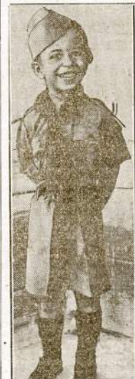
Ar nebus jaunusias karalins pasaulj? Tai 3 metų amžiaus Irako karalins Faissal II. Jo tėvas neseniai žuvo automobilio nelaimėjė ir jis yra teisėtas sosto paveldejas, nors dar tik trjjų metų. Žinoma, šalj valdys jo "patarėjai" iki vaikyscjas suaugis ir metus.

Sustabdžius "Lietuvos Aidą" tie gavailai pasiliktytė be ribeiai apmokamų darbų. Taip ir reikia. Jie to užsiplėnė.