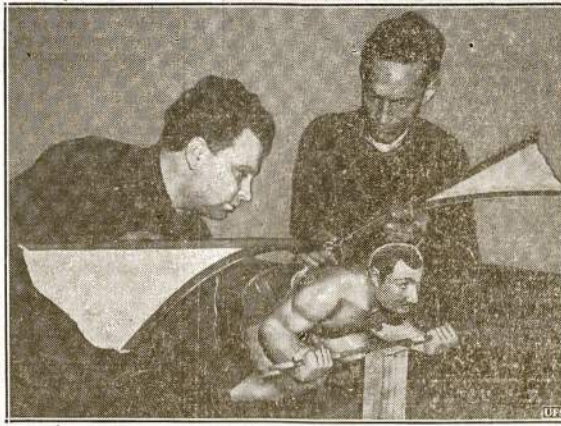
Štai penkioliktą šimtmečio lėktuvo modelis. Čia matome darbininkus išbandant lėktuvą, kuris padarytas sulgy braižiniams garsiojo italo dailininko ir autoriaus Leonardo da Vinči. Da Vinči gyvenė nuo pabaigos 15-to ir pradžios 16-to šimtmečio. Jau ir tais laikais žmonės svajojo pasikelti į orą ir konkuruoti su paukščiais. Da Vinči orlaivio modelis turėjo buti judomas sparnais, kuriuos "plasnoro" lakumas savo kojom. Žinoma, lėktuvas nebūvo praktiškas, bet tas skatinio kito išradėjus prie pagerinimo idėjos.

Tikimasi, kad dalis pabėgėlių sutiks eiti ir prie žemės ūkio darbų, o žemės ūkio darbininkų periklavimus dabar yra gana didelis.