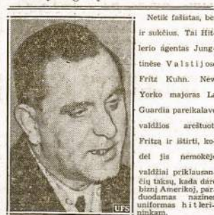
Netik fastinas, bet ir sukčius. Tai Hitlerio agentas Jungtinėse Valstijose Fritz Kuhn. New Yorko majoras La Guardia pareikalavo valdžios areštuoti Fritzą ir iširti, kad jis nemokėjo valdžiai priklausantių taisyklių, kada dirbė būrij Amerikoj, paraudomas nazinės uniformos Hitlerininkam.

Kada nors Jerry O'Connell vėl bus išrinktas į kongresą.