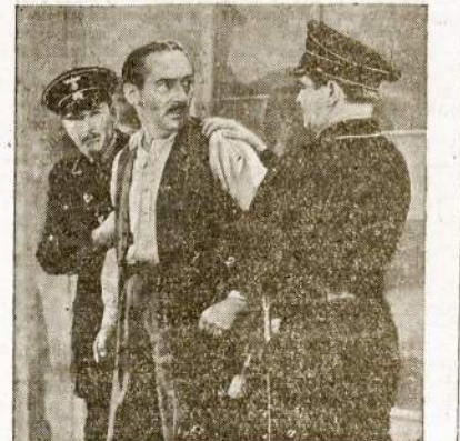
Paul Lukas, amerikietis daktaras ir didelis Hitlerio mylėtojas. Ši scena paimta iš naujo judžio "Confessions of a Nazi Spy", kuris dabartiniai laika rodomas vienam įvairmiesioj teatre Chicagoje. Judis labai įdomus ir pagamintas remiantis tikrais faktais, kada federale valdžia pereinatis metias suciupo gaujį hitlerininkų Amerikoje.

Senam daktarui sunkubius, baigė naujagimį priimti ligoninės daktaras.