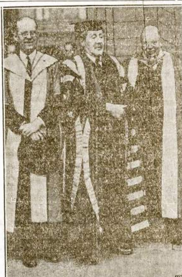
Milioničius Amerikos ambasadorius Anglijoje J. P. Kennedy, kairėje, prima garbės diplomą Manchester universitete. Girdėli, kad Kennedy netrukus bus atsauktas iš tos vietos, nes jis perdaug aiškiai priešingas Rooseveltto užsieniei politikai. Jis daugiau linkęs į Chamberlaino "lietsarginį užgerinimą" faisistų.