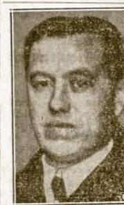
Hitlerio agentas Danzige Albert Foerster.

Anglijos šis sakdamas prakalbė pareiškė, jog nesigaliėtų Danzigo vokiečių kraujo niei gyvasių, kad tik atplėsti tą laisvą miestą ir Lenkijos Koridorių į Baltiko juras ir priskirti prie nazijų Vokietijos.