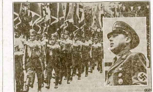
Naziai riaušiniškai Laisvam Danzigo mieste. Hitlerininkas Albert Forster, dešinė, kursio Danzigo vokiečius "gryžli" tėvyne". Jei Danzigas tapty prijungtas prie Vokietijos, tai faktiniai tuom būtų užkirstas Lenkijai kelias į juras. Netrukty ilgai kaip ir visa Lenkija patektų po Hitlerio "protekcija", kaip dabar yra "globuojama" čekoslovakija.

Simno valsė. Ponikiškij km. birželio 21 d., tulas ukinkinas muš'na bepudamais doblus aupties pasipainiojusiam vaikui koją.