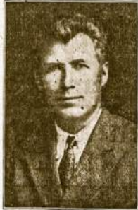
F. Abekas "Vilnius" Redaktorius.

Sokiams gera orkestra — Prasiđės 2 val. popiet.