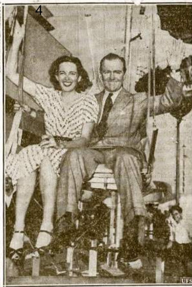
Penkias valandas ši jauna newyorkiečių porė kabojo 125 pėdas ore, kai įsautinėj Parodij parašiotų mechanizmas sugedo. Mechankam tačiau pasisekė juos nuleisti pavaliai žemyn. Tūkstančiai žmonių išmėjo įvyki kvapą sulaukę bijodami, kad nentsitiktų skaudu nelaimė.