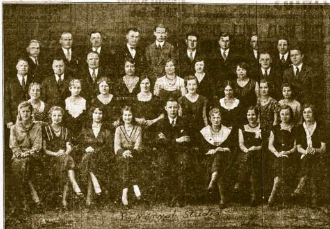
Chicago Radio Orchestra