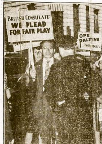
Bostono žydai pikietuoja Anglijos konsulatą, praturdami prieš susiaurinimą žydų įvaizavimo į Pajūį.

Washingtonas. — WPA administratorius pranešimui, per pastaruosius 8 mėnesius WPA darbininkai pataisė bei naujų nutiesė 68,000 mylių kelių. Tuo pačiu sykiu WPA darbininkai pataisė bei naujų pastatė 13,000 tiltų.