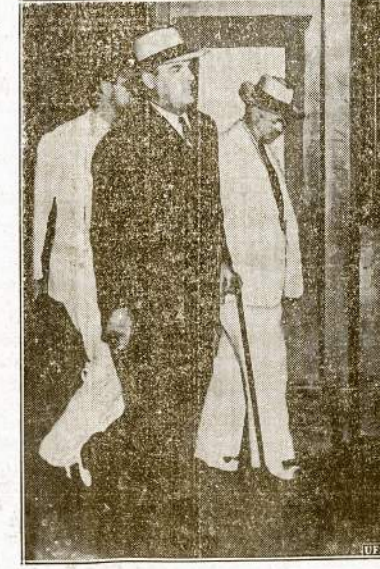
Buvęs Louisiana valstijos gubernatorium R. W. Leche vedamas federalės valdžios agentų kalėjimam. Leche kaltinamas naudojės valdžios autoritetą pasipinigavimui.

Komunikantas pranešė šis ži- nią nepažinti vardu valstybių, kurių nepriklausomybe Lenkija susirūpinus. Tačiau šiu tvirtinama, kad diplomatiniai rateliai esą tikri, jog Lenkija turi mintį) Lietuvą, Latviją, Vengriją ir Slovakiją, o taipgi ir Rumuniją. Anglija ir Francija jau pasi- žadėjus užtikrinti Lietuvos ne- priklausomybę. Tačiau dar ir po šiai dienai priešinis Sovietų Sąjungos sąlygom, kurios kaip tik ir reikalauja užtikrin mo ne- priklausomybės Pabaltijos val-