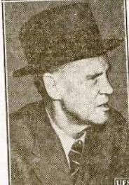
Vistiek nemuštija skraidyti.