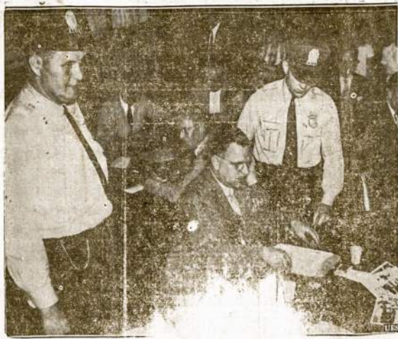
Hitlerio agentas Fritz Kuhn kongresmano Dies komiteto posėdyje tarsiškai prieš Roosevelto administraciją, o du policistai užtikrina jam taip daryti.

"Liet. Žinioms" veritė apsidaryti, nes veidmainiai niekur nėra pakęžiami ir rimtam laik-