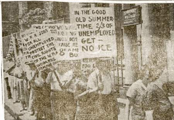
Pikietininkai New Yorke prie pasalpos stoties. Prie šios demonstracijos prisidėjo ir WPA darbininkai reikalaujami pakėlimo algos 10% dirbančioms ant WPA. Bedarbiai reikalauja darbo, arba didesnių pasalpų.

Gamybos pakėlimu, politinės sąmonės ugdymu ir visuomenės aktyvinimu daug ką pasieksime, kad didžioje Sovietų Sąjungos tautų šeimoje, vadovaujant Komunistų Partijai, po Stalino konstitucijos saule, lietuvių tauta greitai išlygintų visas spragas ir atsilikimą, kuri paliko buržuazinė vyriausybė, ir vestų Tarybų Lietuvą į žydėnį socializmo šalies respubliką."