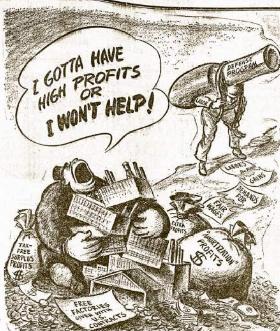
TIKRAS AMERIKOS PATRIOTAS" Šis piešinys tikriausiai vaizduoja dabartinę situaciją, kada šalies valdžia veda kampaniją apginkluoti šią šalį apsigynimui nuo išlaukino priešo. Po priedanga patriotškumo, manufaktūristai kraunasi milijonus dolerių pelno, o visa sunkioji našta guli ant pečių darbo liaudžiai.

Tuo išmėgintu savystovio protavimo keliu mes pasiryžė eiti ir toliaus. Peržėję savo praėitį, mes galime tik didžiūotis. Reakcinės gaujos psichologija mums visuomet buvo svetima.