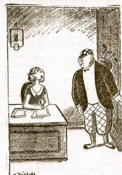
Sekretorka: "Linksmų vakacijų, ponuli." Bosas: "Vakacijų? Kokios čia vakacijos ketvertas mėnesių."