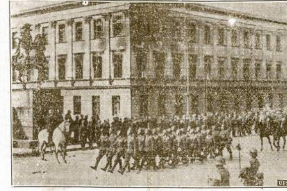
Nazių armija Varšuvoje. Kaip jau žinoma, naziai galėjo Lenkijoje taip lengvai laimėti vyriausia todėl, kad Chamberlain ir Daladier padiklavo šiektų valdžiai neginti šalį.