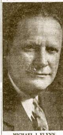
MICHAEL J. FLYNN

Marquette Parko žmonės kalba apie demokratų organizacijos veiklą. Nori, kad būtų plačiau pravaista naujos dalybos programos.