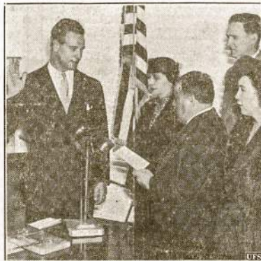
New Yorko majoras La Guardia prisalkina basebolininką Lou Gehring valstijos parolės komisionierium. Iki neseniai buvo vienas geriausių Amerikos basebolininku, Gehring neseniai persirgo vaikų paralyzium, kas padarė jį netinkamu atletikos žaidimui.

Londonas. — Anglijos vyriausybė nuginčino Italijoj ir Vokietijoje pasiklidusias žinias, buk Winston Churchill, naujasis karinio laivyno ministeris, įiteikęs Chamberlainui rezignaciją. Sako, tai "grynas prasimanymas". Gal ir taip šiuo sykiu, bet yra tikra, kad tarpe Churchill ir Chamberlaino čia aštri kova. Churchill niekadoms nesutiko su Chamberlaino užsienio politika.