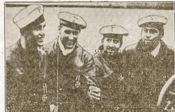
Nazių propagandos ministerija tvirtina, jog tai šie jureiviai esą nusikandė didžiulį Anglijos jūrų milžiną "Courageous" kartu su keliom dešimtim karinių orlaivų. Visi nazių submarinos jureiviai buvę apdovanoiti "gelžinio kryžiaus" ordenais.