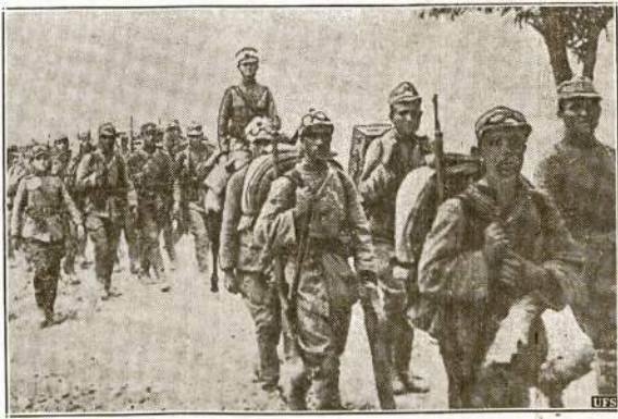
Turkijos kariuomenė, kuriai gali prisieliti liet kraują už angly ir francuzų imperialistų reikalus.

Bet dabar visi matom, kad mūsų bičiulio tvirtinimai nebuvo nuosirdys.