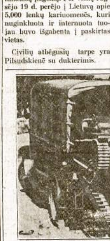
Kad įtikinti pasaulį, jog "vakary fronto neviskas ramu", francuzų cenzorius pradėjo šį atvaizdą ir pareiškė, jog tai esanti viena iš daugelio tankų, kuriom francuzai ir anglai bombarduosią nazių Siegfried tvirtovės.