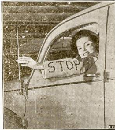
Visgi "pagerinimas". Viena automobilių kompanija prie 1940 metų modelio pridėda dar ir šitokį pridėkų: metalinę rankovę su žodžiu "STOP". Ir naktia tą rankovę užpakalyj važiuojas automobilistas pamatys, nes stiklinės raidės atmuša šviesą kaip veidrodys. Sako, tas įtaisas ypatingai patiksąs moterim automobilištinėm.