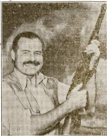
Garsysis amerikietis korespondentas ir novelistas Ernest Hemingway pushtini migsta medzioli. Ir dabar jis medziolo Idaho valstijos girsta. Bemedziomas Hemingway dažniai parašo pacius geriausius savo kurninus.