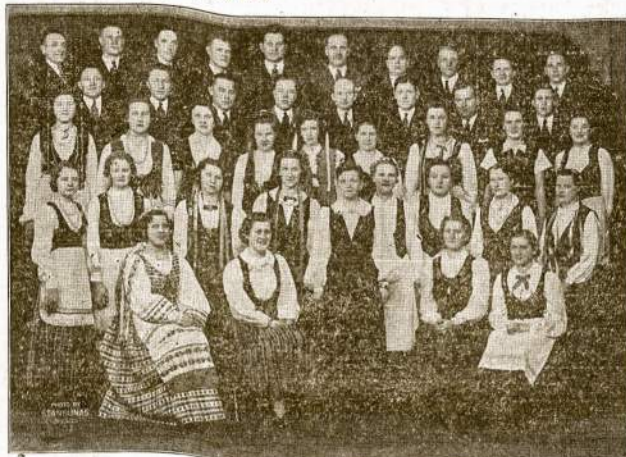
L. JAUNIMO KULTŪROS RATELIO CHORAS