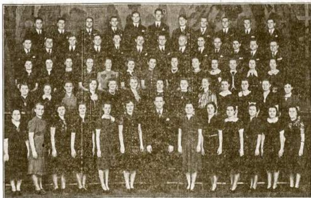
LAISVĖS KANKLIŲ MISRUS CHORAS