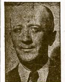
WILLIAM Z. FOSTER

Kviečia visus dalyvauti Rusijos Revoliucijos paminėjimo mitingė lapkričio 7 d., Ashland Auditoriume.