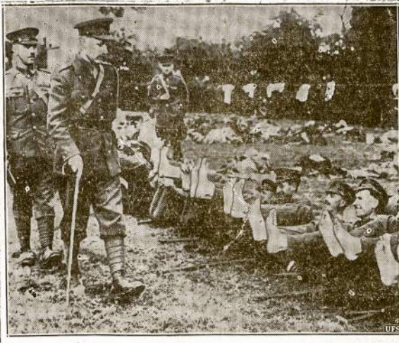
"Kornų" inspekcija Anglijos kariuomenė. Du karininkai eina pro suguliusius kareivius, kurie nusiavę batus rodo užtrūnas ("kornus") ant kojų pirštų. Paveikslas nutrauktas "kur nors Francoje".

Jei yra daugiau praleistų, lauksime nuo jusų patėmijimų. —Komišja.