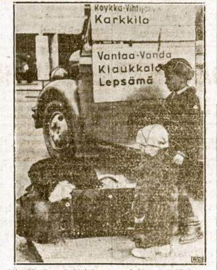
Anglijos ir nazij karinė propaganda Suomijoje (Finlandijoje). Vokiečiai dvarininkai ir baronai Finlandijoje gvoltu saukia, kad tai valstybė "grėšia pavojus" iš... Sovietų Sąjungos. Parodymų pasauliui, jog "tikrai taip", tie karo kurstytojai platina šitokius pavėlusius ir aiškina, jog štai, žiūrėkite, Finlandijos valkiaučiai evakuojami iš miestų į saugesnes vietas. Tuom tarpu Maskvoj eina derybos tarpe Finlandijos ir Sovietų Sąjungos, kurios ne karą lemia, bet taiką.

Laikraščiai kėlė baisy lermą. Buržuaziniai laikraščiai buvo pilni isterikų žviegių. (Tasa ut ketviro puslapiu)