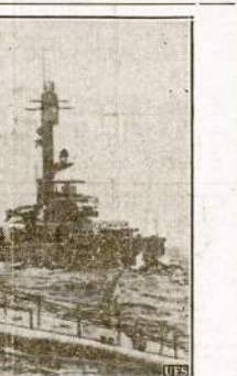
Nemažai intrigantių guma prieglobstį Finlandijos vandenyse, visai arti Leningrado. Čia matome neva finų šarvuotlaivius ir submarin, jam falabū butų pravarata turėti liuosas raiškas Finlandijoje, nes per ją greičiausiai galėtų bombarduoti vieną didžiuliasj Sovietų, industrijos centrą Leningradą.