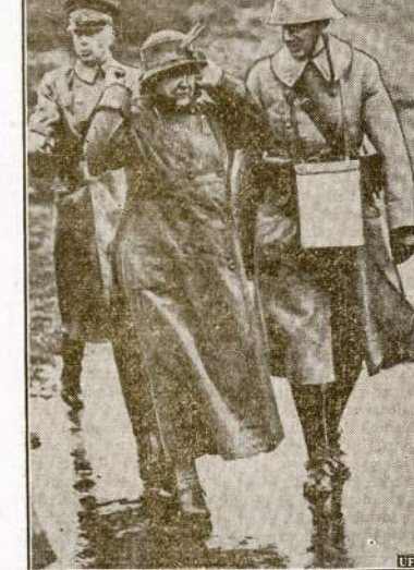
Senė Olandijos karalienė Wilhelmina apžiurinėja valstybės rubežius, per kuriuos hile diegū gali pradėti vėžtis nazų kariuomenė. Olandija, žinoma, vargiai galėtų sulaukyti nazus, bet visgi rengiasi ginti šalies nepriklausomybę, nors ir didelis plotus žemės reikėtų užlieti vandeniū išdaminatavus tvenkinius.