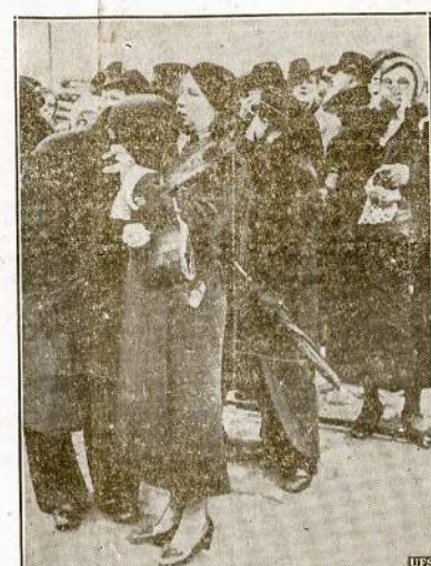
Galai, bet turi važiuot. Tai bursų vokiečių Liepojos prielaukoj. Vieni jų gręžta Vokietijon, kiti juos išlydi.

Newark, N. J. — New Jersey ir Virginija valstijos republikonai politiniai susiprėjo. Į abiejų valstijų seimelns jie išrinko daugiau atstovų, negu demokratai.