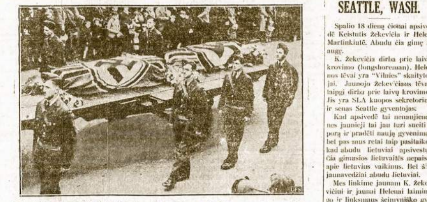
Dabartinis karas, ypatingai "vakary fronte" daug kuom skiriasi nuo pereinū pasaulinio karo. Viena, ten dažniausiai "viskas tyku." Bet pasitiko ir "nelaimiū" Francijos-Vokietijos parubėži. Aną dieną vokiečiai nuosėdė tuom patin anglijai nudėjo ir sien šiekė iškilmingas militariškas laidotuves. Atsimokėdami tuos patin anglijai nudėjo do nazin karėvini. Šiame atvaizde matome angly cenzuros perėistų vaizdą, kur naziam suteikiama militariuė pagalba.