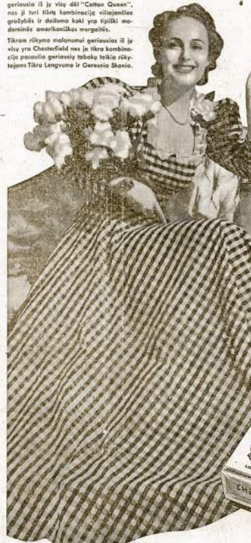
Mūsų PHIL OFFER lėva metu buvo parinkto geriausias iš jų visų "Cotton Queen", nes ji turi šilų kombinaciją vilnonės grolytis ir didelio koki yra tipiški modernūs amerikoniškus mergaitės. Tikram rūjyrai malonumai geriausias iš jų visų yra Chesterfield nes jo tikro kombinacija pasaulio geriausių tabakų teikia rūkytojams Tikro Lengvumo ir Geresnio Skonio.