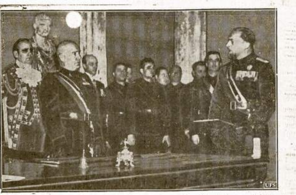
Mussolini su ministėrių kabinetu. Barzdotas vyras yra Dino Grandi, buvęs užsienio reikalų ministris, paskui buvęs ambasadorium Anglijai, o dabar justicijos ministris. Mussolinio nusitrukimas pavelkio lygion su Dino Grandi, kaip sako atitinkami šaltiniai, turis charakterizuoti Mussolinio "neutraliskumą."

Beveik bendras anglų ir francuizų propagandos ministerijų išleistas pareiškimas sako, naziai nedrsoys praėitį šeštadienį pulti Holandiją, nes Anglija ir Francija buvo užtikrinusi Belgija, kad jai padės gėti užpuilt Holandiją.