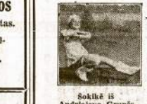
Sokikė iš Andriejevo Grupės