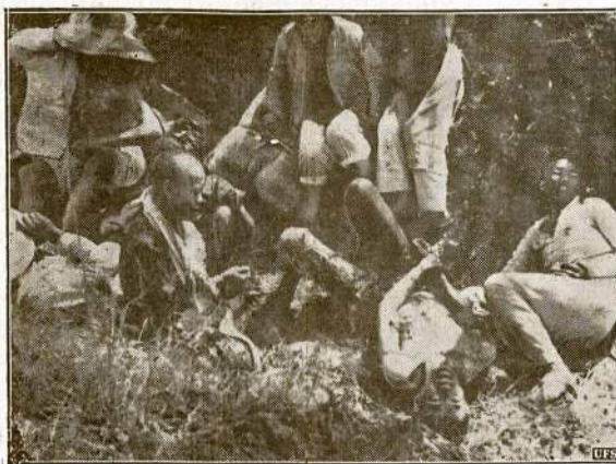
Bury's kinų valstiečių sužeistų japonam bombarduojant tulį kaimą. Kaimui esant toli nuo miesto ir neturint medikamentų pas save, sužeistiem prisiėjo iki mirties kentėti laisius skausmus.