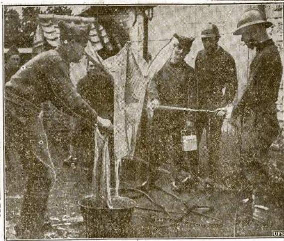
Tai šitaip Anglija gynė Lenkiją. Šis atvaizdas imtas tomis dienomis, kai Lenkija, kaip valstybė, gyveno paskutines dienas.

Londonas. — Buvęs čekoslovakijos prezidentas Benes ir pats save apšaukęs nesamos Lenkijos valstybės premieru gen. Sikorskis, sutarė eiti išvien su Anglija ir Francija karė prieš Vokietiją, kad "atitaisyti jų valstybėm padarytą blogą."