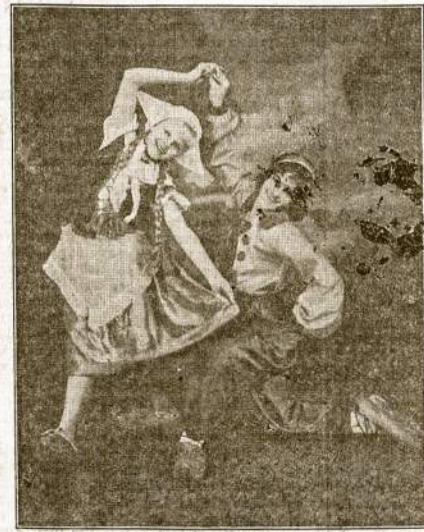
ANDRIEJEVO MOKYKLOS ŠOKIKES