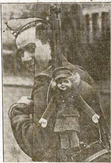
Juokiasi, nors žino ar begrybė iš karo. Anglas kareivis išsidamas į fėdą nešasi" lėlę, kuri, jo nuomone, gali jam suteikti juką.

Kaunas.—"Lietuva didžiausia Baltijos valstybė". Tokiu antirašte didysis belgų laikraštis "Soir" įsidėjo straipsnį apie Lietuvą, patilustruotą Lietuvos užsienio reikalų ministru Urdžio paveikslu, ir aprašo Lietuvos pastangas atsistai savo senąją sostinę, pabrėždamas lietuvių kantrumą ir politikos nuosaikumą, siekiant savo teisių.